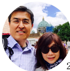
ICEJ總裁 猶根博士 2018年8月於耶路撒冷