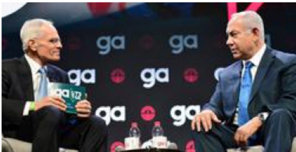
納坦雅胡總理出席北美猶太人聯合大會

以色列班傑明·納坦雅胡總理於上週三（10/17）下午在特拉維夫所舉行的北美猶太人聯合大會中致辭時指出：他認為散居各地猶太人的各樣事務中，最大的問題是年輕猶太人對於自我猶太身份急遽下滑。