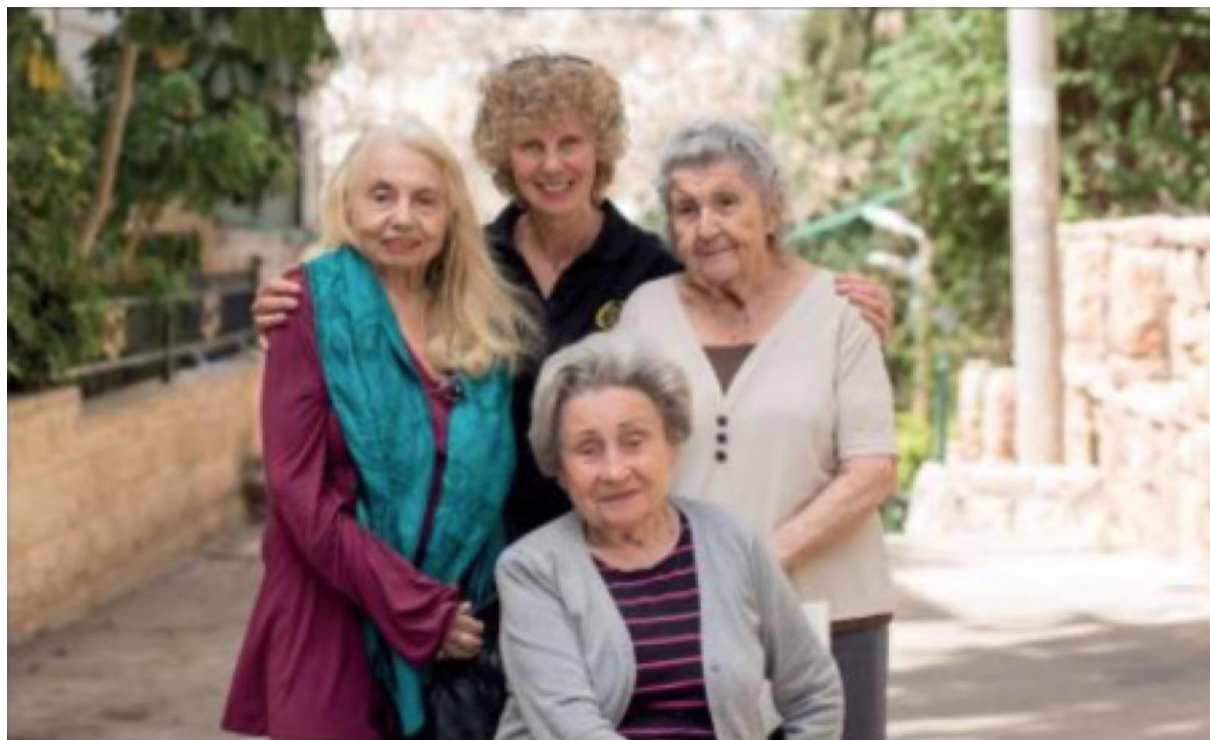
海法之家居民與負責人

過去幾年，隨著入住海法之家的倖存者愈來愈多，也意謂需要的照護愈來愈多。過去我們極需一個物理治療的空間，非常感謝大家的奉獻得以將原有空間整修成物理治療室，使倖存者有合適的空間進行治療。