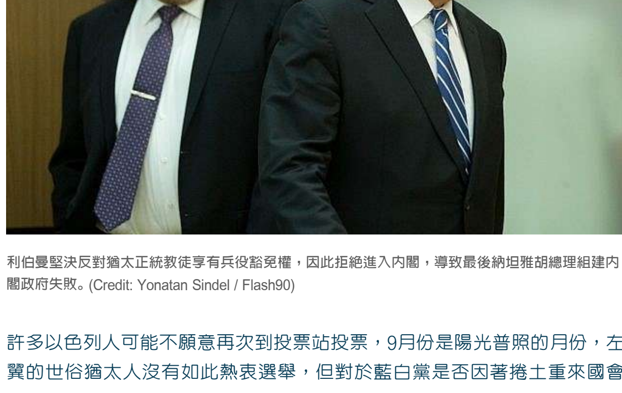
以色列納坦雅胡總理在解散以色列國會法案進行表決後，接受新聞媒體採訪。攝於2019年5月29日國會大廳。