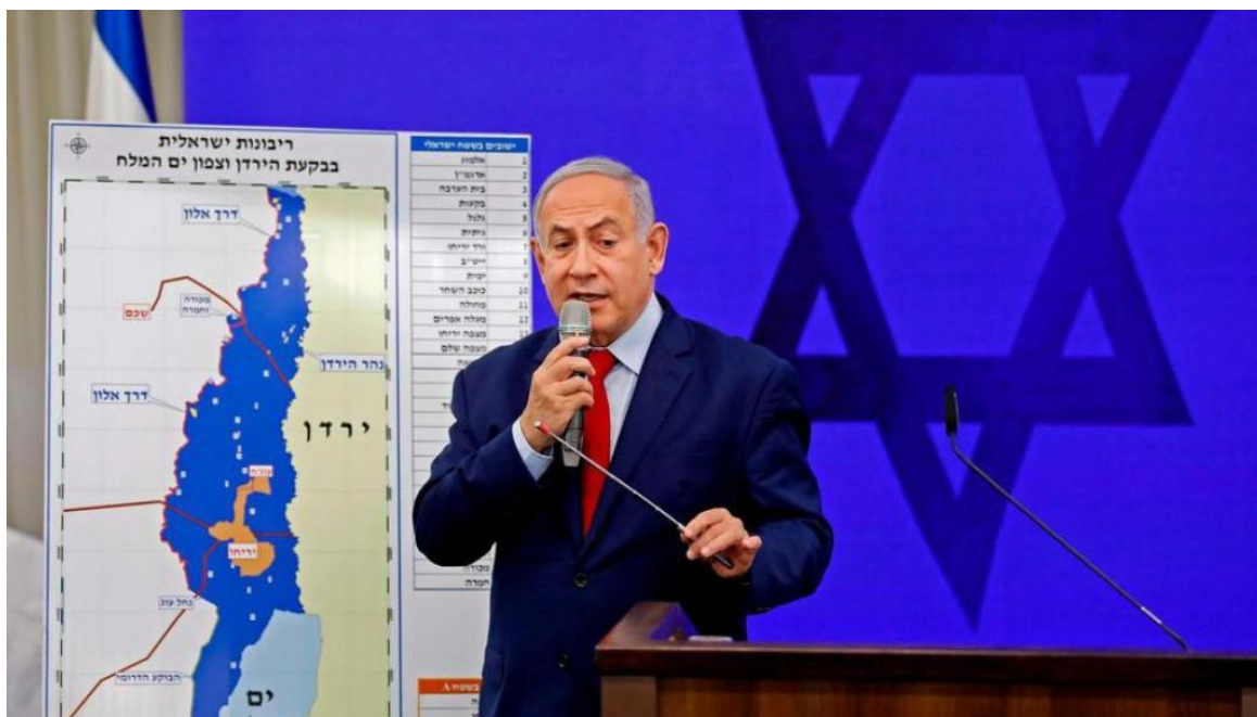
2019 年 9 月 10 日納坦雅胡總理於以色列南地亞實基倫市召開記者會。

當我們在為國會大選禱告時，你很難無視土地的問題，若不然在禱告上有可能僅是蜻蜓點水。我們看見，本週二納坦雅胡總理急忙地召開記者會，發表論述，在即將要選舉前一週，告知大家，若他當選了，就會將約旦河谷與死海北部之地重整，該是以色列主權延伸的地方，他都不會放過！從一個國家總理（君王）發出的呼聲，看起來是因為納坦雅胡向右翼選民催票，與選舉有關；實際上，神將這位君王對全球教會發出呼聲：為以色列關鍵大選禱告，這是一場相關地土之爭。記者會中，當然，納坦雅胡也表明，這些約旦河谷與死海北部的延展計畫需要與美國川普總統商談合議，畢竟全球關注在以色列大選、政局穩定之後，川普政府即將要公佈的「中東和平解決方案-世紀協議」，這些都是與土地息息相關，而土地與百姓是脫離不了關係的。