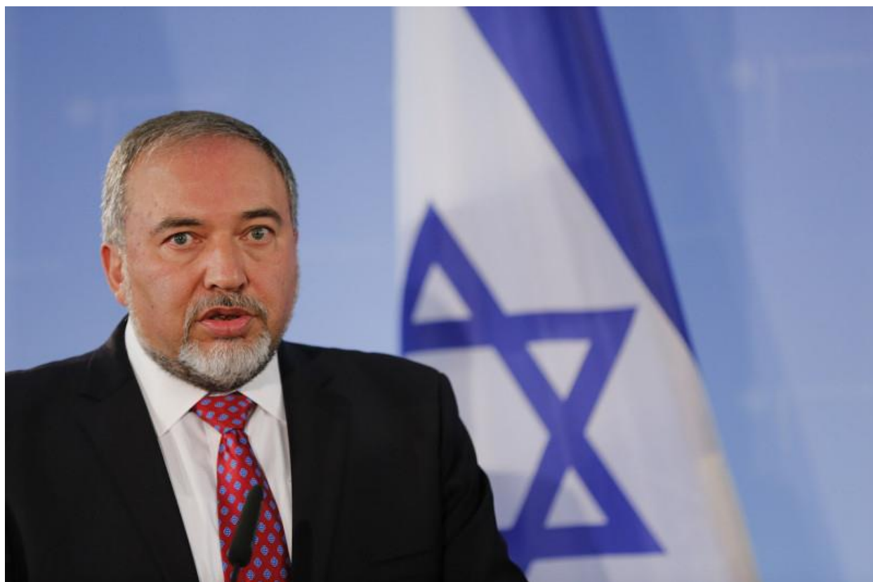
以色列家園政黨（Yisrael Beiteinu）阿維格多·李伯曼（Avigdor Liberman）。

以色列家園黨李伯曼堅決拒絕加入內閣政府因而造成破局，國會選舉重來一遍，他的立場在於要求極端正統派猶太教徒需要服兵役議案，否則拒絕加入執政聯盟，而宗教黨派想當然爾是反對該方案的。61 歲前任國防部長李伯曼，來自前蘇聯時期的摩爾多瓦共和國，於 1978 年歸回以色列，因此在他的政黨內擁有眾多前蘇聯歸回的阿利亞 Aliyah 支持，而前蘇聯歸回以色列的選民們，長期以來對於具有極大權威的哈雷迪派猶太正統教的不滿，也是眾所皆知。蘇聯瓦解後大量的前蘇聯歸回的阿利亞，雖說是有猶太血統，然而生活習慣仍與猶太正統教徒有許多的不同，最大的不同也讓我們這居住在耶路撒冷的外邦人甚為詫異的，便是這些從蘇俄歸回的選民，他們是吃豬肉的猶太人，這總是被拉比們無法接納且多有抨擊，對於哈雷迪猶太教徒來看這些蘇聯歸回的猶太人是不潔淨的，因為豬肉在聖經裡面而言是不潔的。