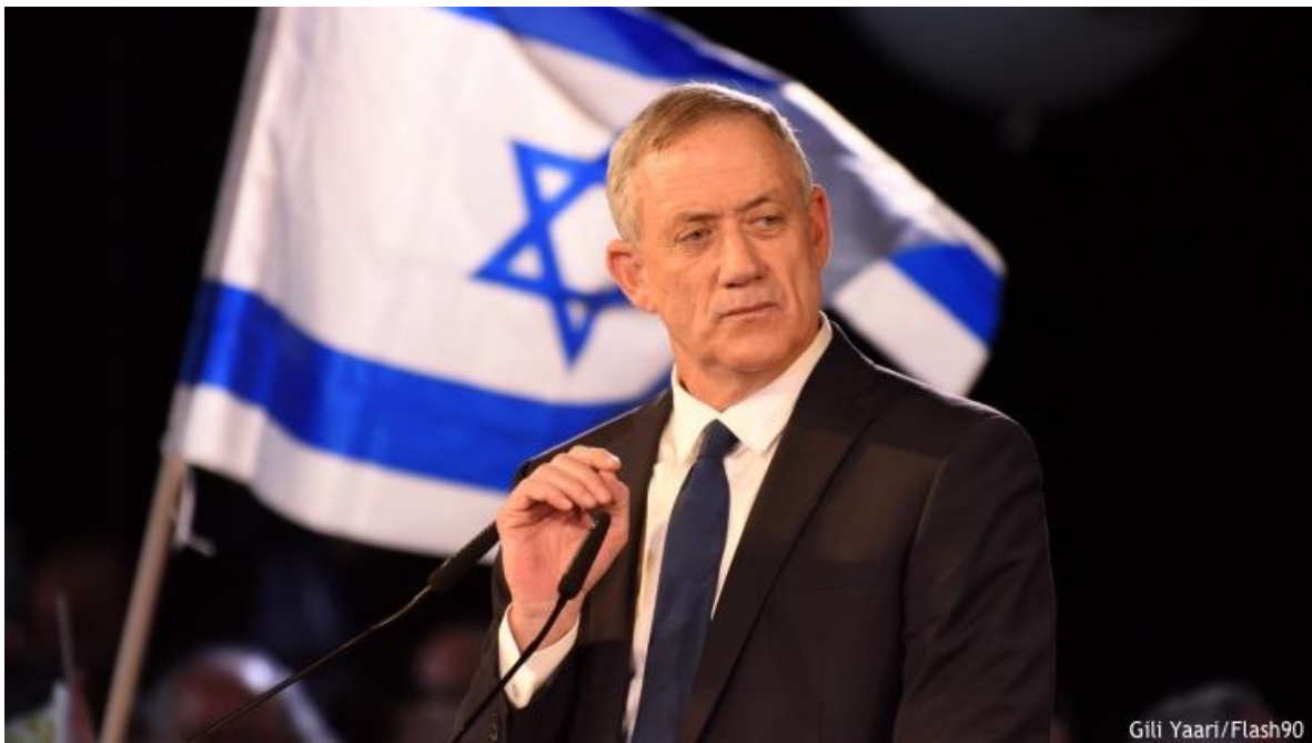
藍白政黨班尼·甘茨（Benny Gantz）。

近年來，以色列公眾，尤其是年輕的以色列人，無可否認地向右傾斜，在社群媒體公開談論中，更是看見已經逐漸擺脫任何支持和平的語言，大家漸有共識，明白支持與巴勒斯坦和平似乎是很愚蠢的一件事，因為巴勒斯坦自治政府背後由恐怖份子法塔赫政權主治，此恐怖政權的宗旨是消滅猶太人，奪回耶路撒冷；這樣的一個政府如何知道什麼是和平？！再加上曾經在 2015 年選舉日前夕，納坦雅胡總理表示「阿拉伯選民成群結隊地出來投票」，造成猶太民眾群起亢奮起來投票的情緒，在當時曾經愈演愈烈。2013 年選舉，投票率是 67.8%，2015 年選舉高達 80%。今年(2019 年)，四月份的投票率僅 61.3%。