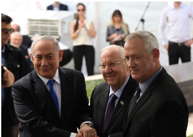
9/19 納坦雅胡總理(左)與里夫林總統(中)並甘茨(右)在紀念前總理也是擔任過前總統的希蒙·裴瑞斯儀式上相互握手。