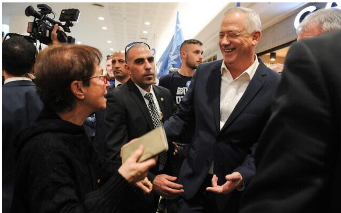
2020 年 3 月 2 日，藍白政黨主席甘茨於選舉日當天，在以色列北部最大的購物商場，海法的大峽谷購物中心（Grand Canyon Mall）從事競選活動。