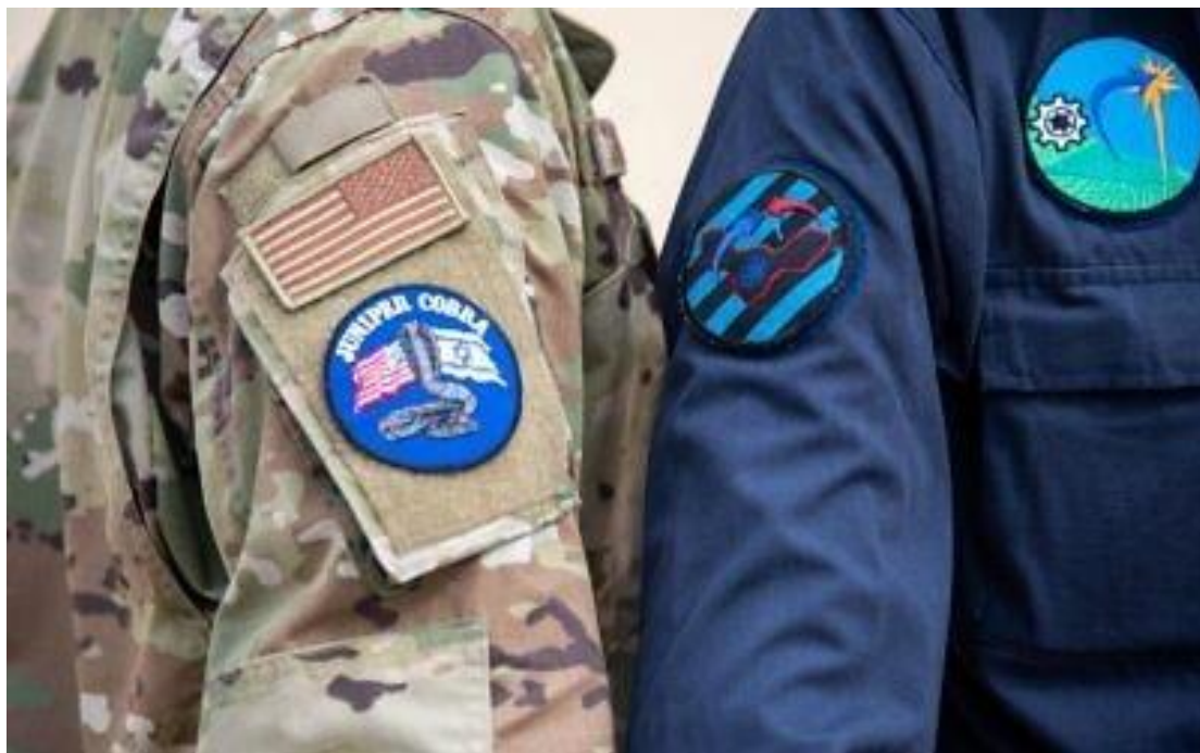
美國和以色列士兵參加 2020 年 3 月在以色列舉行兩年一次的「杜松眼鏡蛇」防空演習。

週三晚上（3/4），以色列國防軍取消了兩年一度的「杜松眼鏡蛇」（Juniper Cobra）聯合軍演展開，此演習是以色列和美國之間為期五天的聯合軍事演習，由世界各地成千上萬的美國和以色列士兵參加，這項演習旨在加強美以軍事合作，重點防禦地區威脅與伊朗攻擊，促進長期安全。