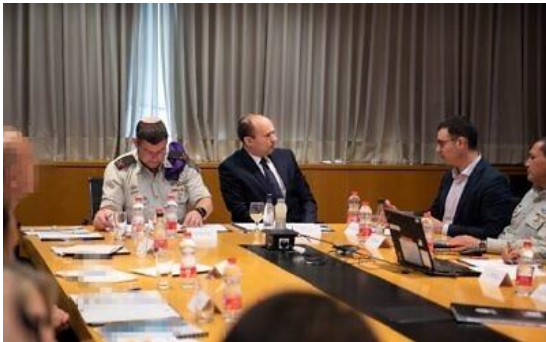
2020年3月4日，位於圖正中間的國防部長拿弗他利·班奈特（Naftali Bennet）會晤以色列國防軍副參謀長扎米爾（Eyal Zamir）和其他國家安全高級官員。

以色列國防軍副參謀長艾爾·扎米爾（Eyal Zamir）的任務是領導軍方應對新型冠狀病毒，並協同各單位，負責國際關係；軍方醫療團；以及指揮地區司令部，這是為了使平民百姓做好應對衝突或災難的準備，在危機期間為民眾提供幫助，並為危機後的重建做出貢獻專門指揮負責民防的家鄉戰線司令部（Home Front Command），一起防疫。