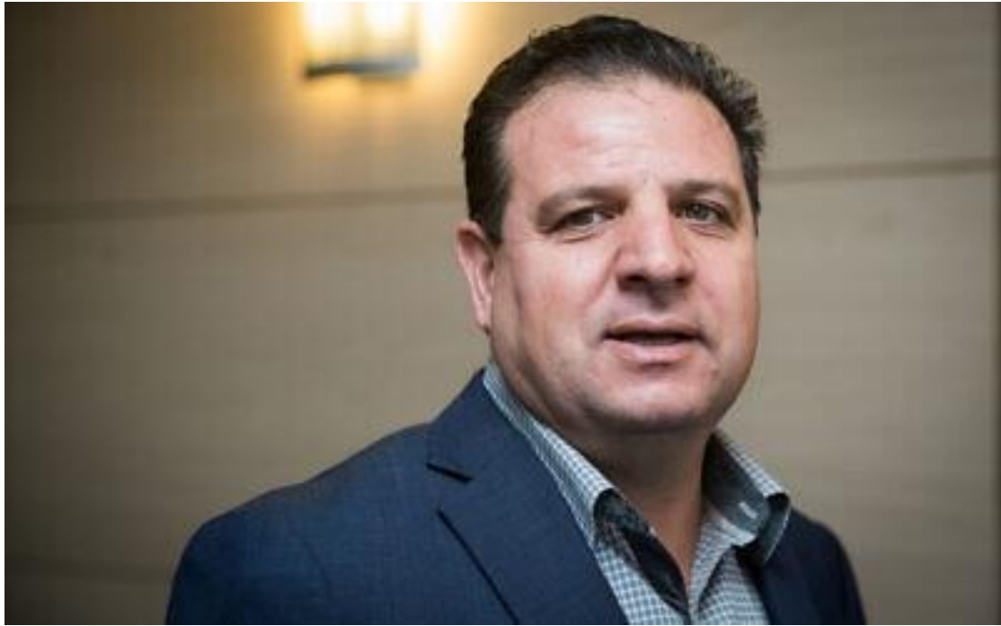
2019 年 9 月 22 日，阿拉伯聯合名單政黨主席奧德（Ayman Odeh）在以色列國會，與該黨成員舉行會議。

要通過立法，阻止面臨刑事訴訟的國會議員就任總理，目前尚不清楚這樣的計畫在技術上是否可行。有些觀察家主張，在政府過渡期間，國會成員私下擬定的非政府立法草案，是無法提交國會審查。