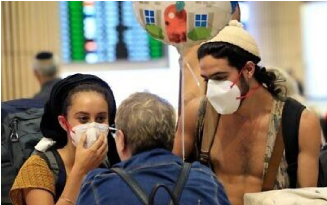
2020 年 3 月 4 日，一對戴著防護式口罩的年輕夫婦抵達本古里安機場時受到家人朋友歡迎。

軍方已準備採取一切必要措施，確保以色列國防軍正常運作，預防該疾病在內部傳播，並且協助國家採取因應措施。發言人表示，「如果一名士兵感染了新型冠狀病毒，並接觸了其他同袍，我們就必須隔離檢疫該同袍，這就是我們必須要做的事。」