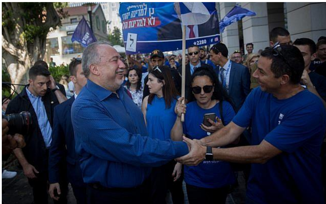
2019 年 9 月 17 日第二次國會選舉日當天，以色列是我們的家園政黨主席利柏曼巡視特拉維夫位在薩羅納（Sarona）市場內的購物中心。(Miriam Alster/Flash90)

「甚至是聯合黨的國會議員都跟我說，這項做法方向完全正確。」他們希望看到納坦雅胡結束任期，搬離位於耶路撒冷貝爾福街上的總理官邸。」