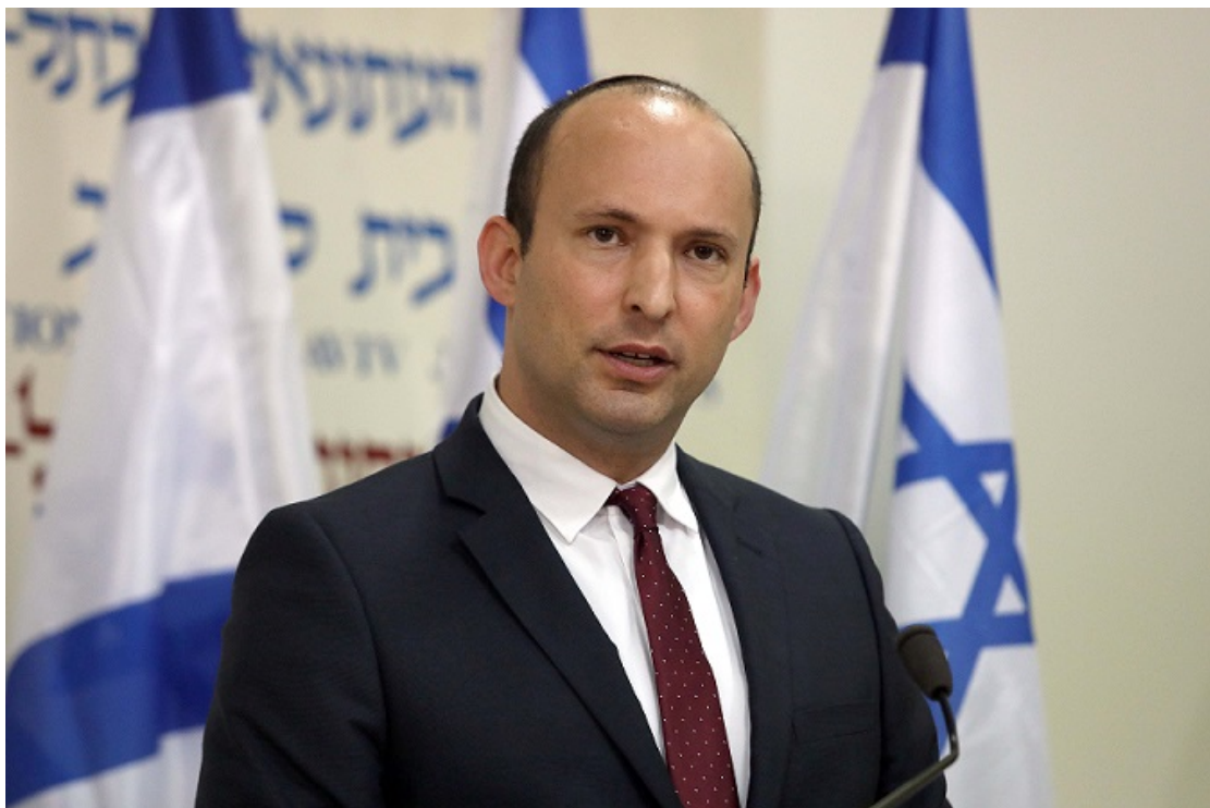
以色列國防部長拿弗他利·班奈特（Naftali Bennett）。

週一（3/16）就在甘茨離開總統官邸後，開始與工黨、梅雷茲黨並以色列是我們的家園政黨黨魁聯絡，並與其見面商談。而當甘茨打電話給宗教政黨各黨魁以及國防部長拿弗他利·班奈特（Naftali Bennett），希望能見面商談內閣政府時，是被拒絕的；班奈特甚至呼籲甘茨加入由納坦雅胡領導的內閣政府，並表明「直到你的政黨脫離支持恐怖份子的阿拉伯聯合名單政黨，我才會見你。」而阿拉伯聯合名單政黨同時也表態，我們推薦支持甘茨組建內閣，是要一個中央左翼政府，我們絕對無法加入支持一個藍白政黨和利庫德政黨共組的聯合政府。縱使目前甘茨擁有一半以上的國會議員支持他組建內閣政府，但並不意味著甘茨能夠召集足夠的國會議員同意他的內閣政府。右翼與左翼各方彼此的對立，立場無法妥協，考驗著甘茨組建內閣的能力。