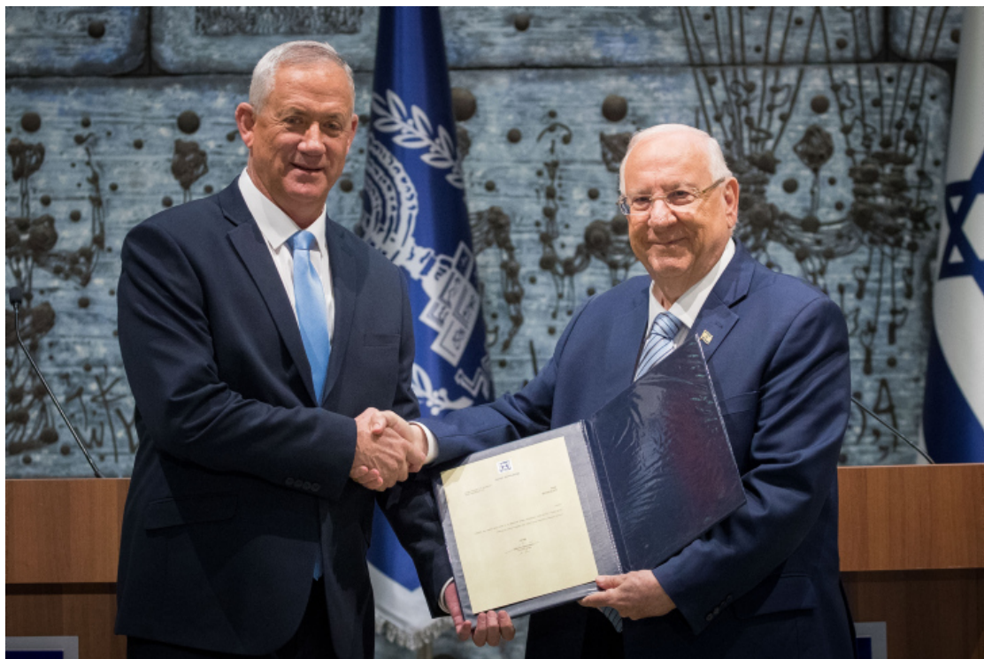
2019 年 10 月 23 日，當時甘茨獲以色列總統邀請授權組建內閣政府。

甘茨已經確定得著超過 61 席位國會議員的支持，並於 3 月 16 日經由里夫林總統正式邀請，授權在為期四週內來組建內閣政府，這是甘茨在 9 月大選後未能成立政府之後第二次接受任命；接下來，在組建內閣政府期間，席位超過 3.25% 的門檻的各個政黨，是否願意讓甘茨買單，推派部長來組建內閣，是所屬重點；而阿拉伯聯合名單政黨「政黨內有國會議員是支持恐怖份子在加薩攻擊以色列的行為，並中心思想是奪回耶路撒冷成為巴勒斯坦的首都」與以色列是我們的家園政黨，這次雙方能夠力挺甘茨，雖說不是握手，但在某個層面上能夠聯手，令部份人士感到詫異；其實，也不感意外，畢竟能夠促成他們聯手的橋樑就是：不再納坦雅胡！是的，這股仇恨與絕對，促使雙方死對頭不對盤的政黨而聯盟，共推翻納坦雅胡政權。