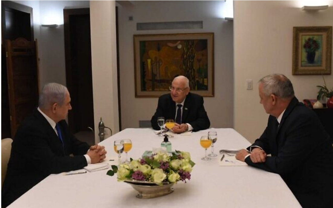
2020 年 3 月 15 日，納坦雅胡（左邊），魯文·里夫林（Reuven Rivlin）和甘茨（右邊）在耶路撒冷舉行會談。

機和帶來的影響；我們終究不該讓這國家再進入第四次大選。終究就這點上，我們的看法並不一致。」