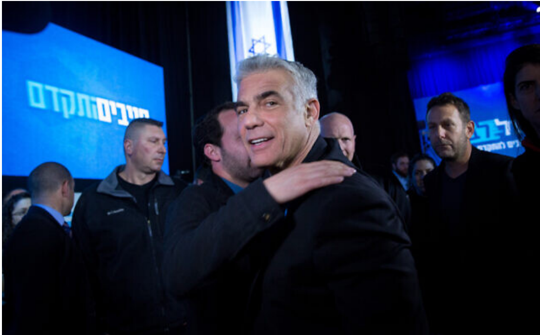
2020年3月3日，藍白政黨拉皮德在特拉維夫參加選後活動。

不過，對甘茨而言，道理其實很簡單，也很務實。他認為他所面對的是兩位納坦雅胡；雖然這兩個政治人物的優先考量，終究不是他能夠認同的。其中拉皮德，無法在國家有難時，提供穩定的聯合內閣；而納坦雅胡卻可以。