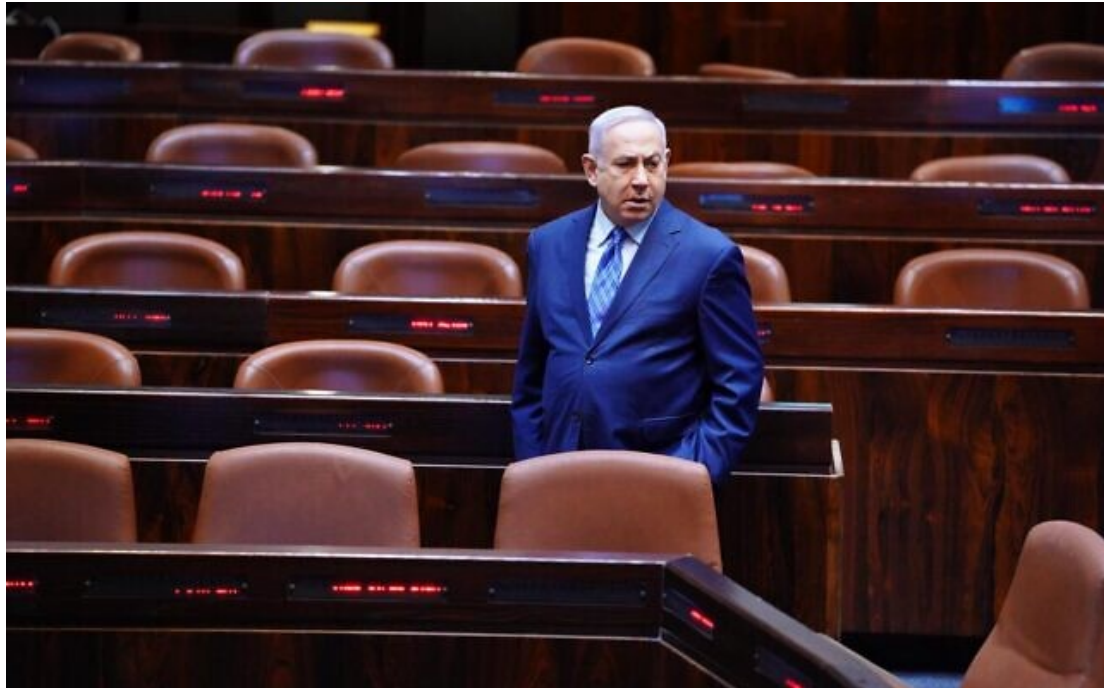
2020年3月26日，以色列總理納坦雅胡在以色列國會。

以色列未來黨國會議員奧弗·謝拉(Ofer Shelah)週四(3/26)忿忿不平地表示：「在重要時刻，甘茨卻打退堂鼓。」