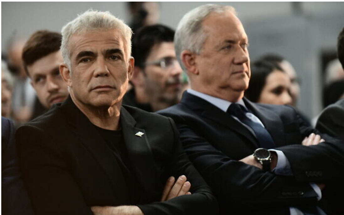
2020 年 2 月 20 日，拉皮德（左邊）和甘茨在特拉維夫向支持者發表談話。