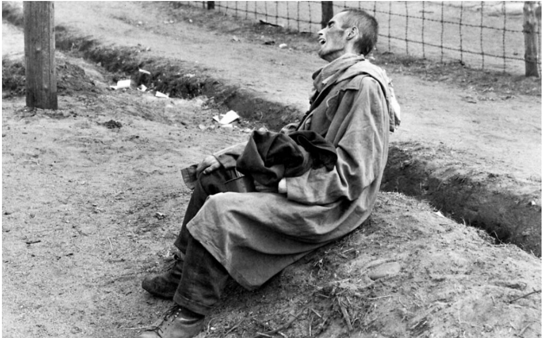
於 1945 年 4 月拍攝貝爾根-貝爾森集中營內的受難者。 (public domain)

勒納寫道：「休斯將貝爾根-貝爾森集中營裡的每位倖存者，當成是他親身拯救的對象。雖然無法阻止成千上萬的人死去，沒有人的生命該如此終結。但在集中營解放後十五年，他擁抱機會，為臨終病患提供了人道對待的做法。」