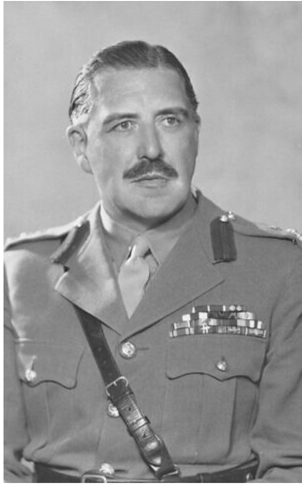
英國旅長格林・休斯。

勒納表示，休斯做事「講求方法和工廠式效率」，知道要將資源運用到極限，把 DDT 化學藥劑噴灑在衣服的每個角落，以消除集中營內的斑疹傷寒和其他疾病。勒納表示：「接著他將整個營區都燒掉。」