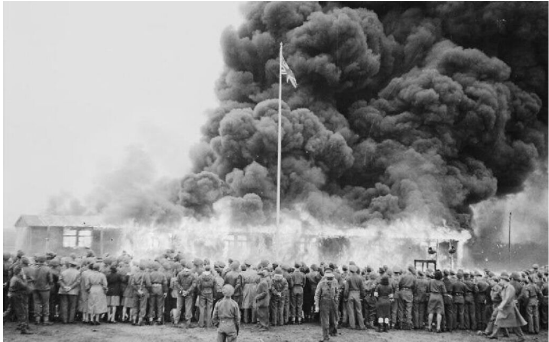
1945 年在德國貝爾根-貝爾森集中營的最後一間房舍進行焚燒儀式。 (public domain)

德國貝爾根-貝爾森（Bergen-Belsen）——當盟軍第一批醫官抵達所謂的貝爾根-貝爾森「恐怖集中營」後的幾天內，英國旅長格林·休斯便打算在當地蓋一間歐洲最大的醫院。