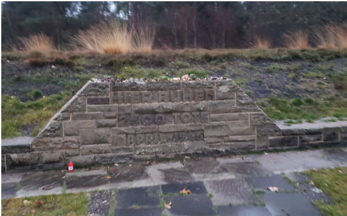
大型墳塚內有 1 萬名罹難者，屍首在貝爾根-貝爾森集中營解放期間仍未安葬(攝於 2019 年 11 月 28 日)

在給英國政府的報告中，休斯抱怨照護病患和老年人口的資源不足。他敦促政府應為照護體系大幅提供資金，這些照護機構通常需要仰賴宗教團體和志工的支持。過程中，他協助促成了英國國民醫療保健服務（National Health Service）的創立。