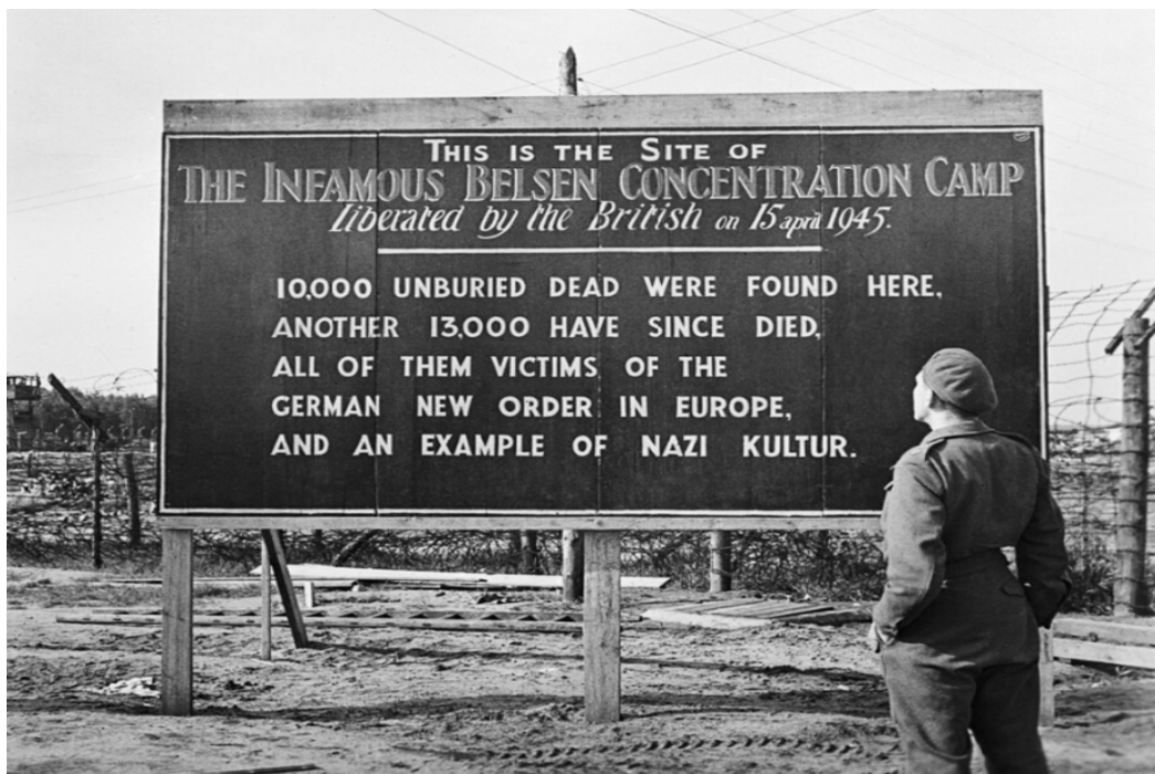
1945 年 5 月 29 日，一名英國軍官站立在德國貝爾根-貝爾森集中營入口處豎立的標誌牌前。