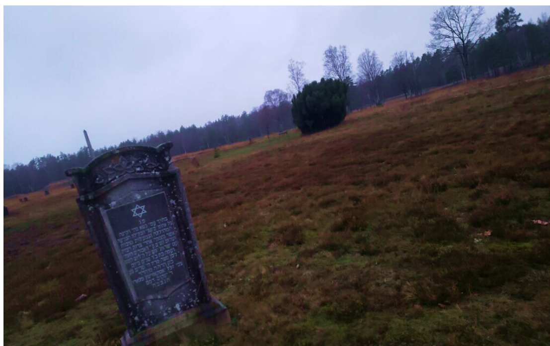
在德國貝爾根-貝爾森田野上的紀念墓碑。（攝於2019年11月28日）

當問到休斯為了終止疫情，在貝爾根-貝爾森集中營採取的措施時，勒納指出了英國軍隊的募兵情況。勒納表示：「英軍治軍嚴明且反應迅速；但在面對休斯的情況時，卻未能盡速反應，或即時補足人力。」休斯設立的醫院，成了歐洲最大的醫院。休斯負責監督工作，替曾為階下囚的1萬3千名倖存者提供照護。勒納表示：「他是在跟時間賽跑。」休斯採取的果斷行動，包括讓英軍控制集中營附近的醫院，請德國病患將床位讓給這些集中營受難者。他也要求德國當地的領導幹部「參觀」貝爾根-貝爾森集中營，讓數百位幹部被迫見證他們下令執行的成果。