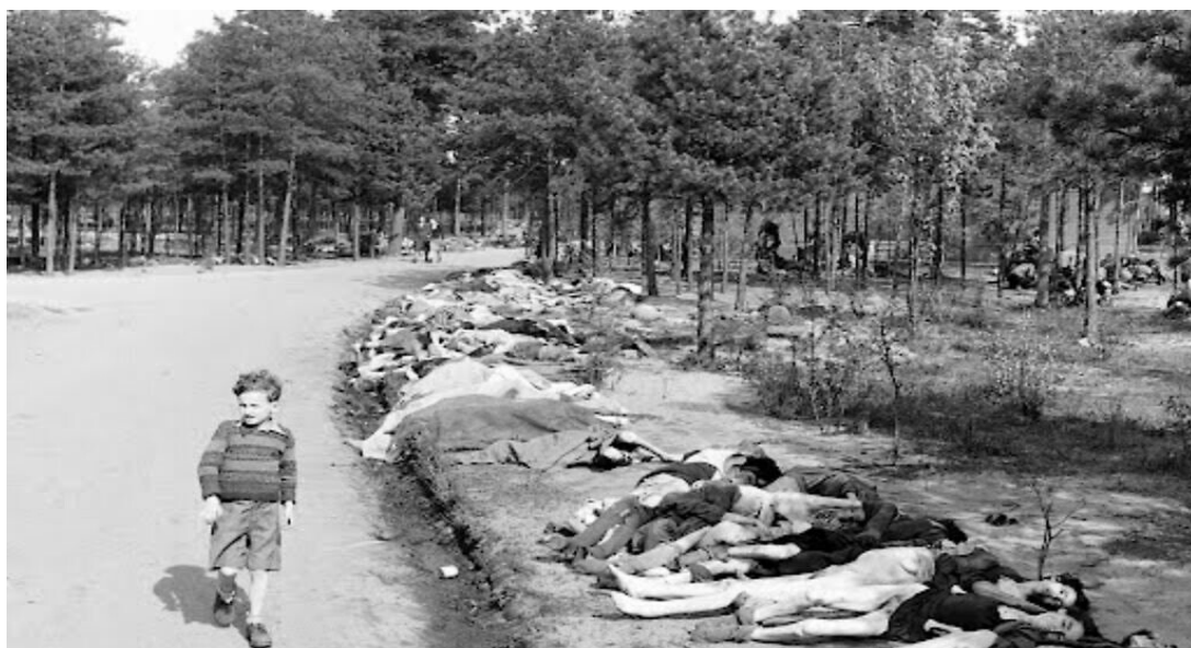
解放後不久的德國貝爾根-貝爾森集中營。(public domain)

勒納是波士頓大學「品格與社會責任中心」（Center for Character and Social Responsibility）的資深學者，她寫道：「撤退後若接受基本照護，是否能提高這個人的存活率？救治工作就是按照這個原則進行。」