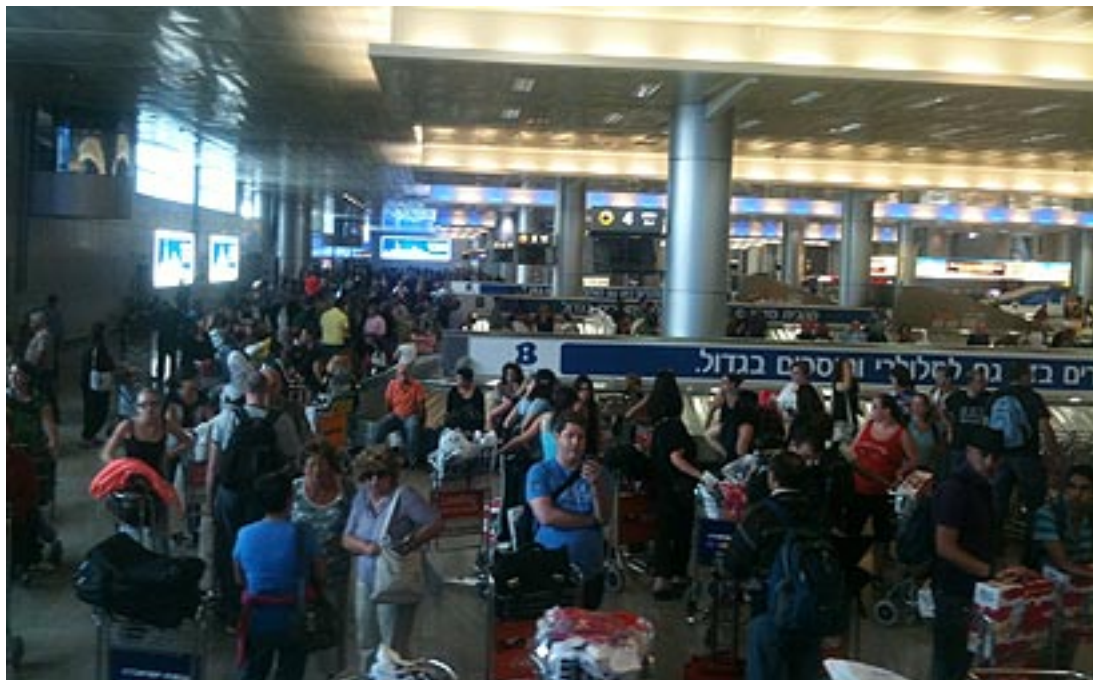
去年猶太新年假期之前，乘客在人潮眾多的本古里安機場內。

今年猶太新年是從 9 月 18 日星期五開始，接著是 9 月 27 日的贖罪日和 10 月 2 日的住棚節。