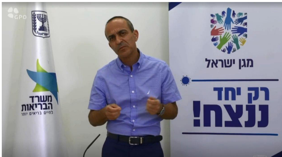
羅尼·甘佐 (Ronni Gamzu) 教授。

以色列衛生部表示，週三新冠肺炎確診病例為 3,074 人，是以色列有史以來最高的單日感染率。