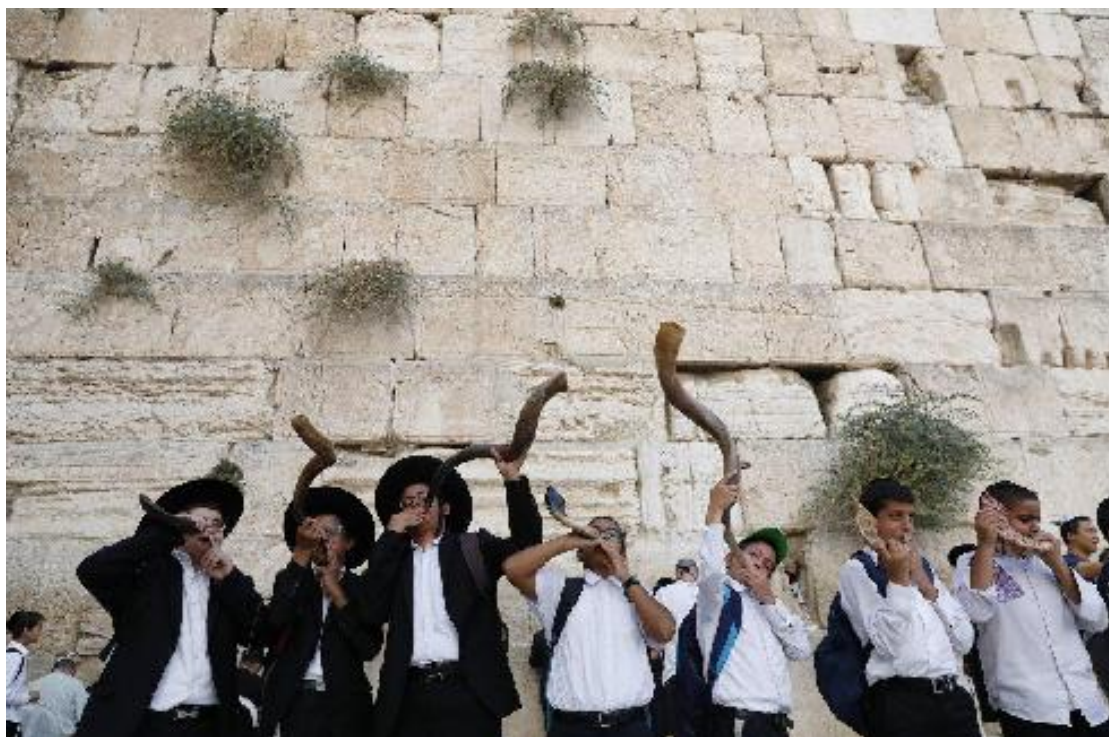
新冠肺炎大流行之前的猶太新年，在耶路撒冷哭牆吹角。

根據以色列衛生部最新的數據顯示，該國人口最稠密的城市耶路撒冷是以色列新冠肺炎病例數最多的城市，有 19,170 例。該城市也擁有最多主動篩檢病例，有 2,730 人，而且在過去 7 天內病例增加數也最多，有 1,322 人。