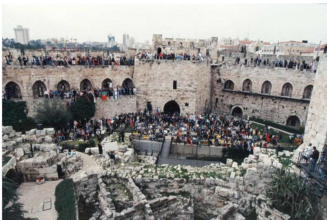
1996 年—第三屆基督徒猶太復國主義代表大會

由於 ICEJ 長期與以色列准將茲維·吉瓦蒂 (Zvi Givati) 保持聯繫，在第一時間就趕到現場，隔天就發放衣物、急救包和盥洗用品給流離失所的家庭。以色列電視台第一頻道 (Channel One) 播出專題報導，報導 ICEJ 能夠迅速回應，並決定整個 ICEJ 人員不會像使節團 (Diplomatic Corps) 那樣撤離該國。