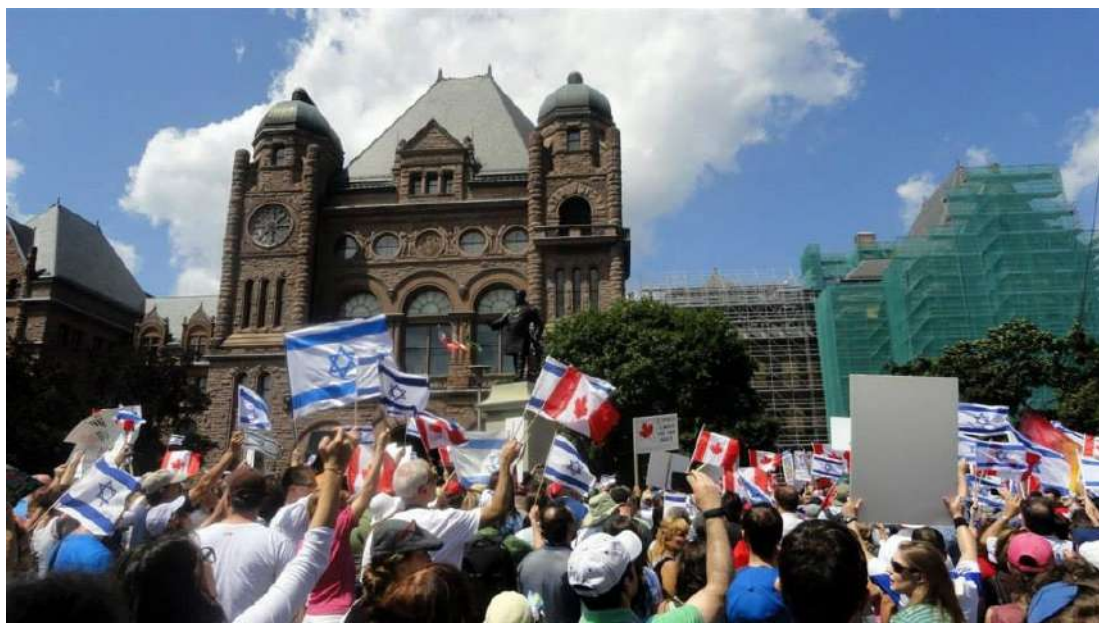
2014 年—ICEJ 在第三次加薩衝突中再次集會

2014 年夏天，以色列和哈瑪斯在加薩邊界一帶爆發第三次大規模的火箭戰。在為期 50 天的衝突中，ICEJ 為脆弱社區另外提供十座可攜式防彈掩體，帶著一群孩童和老人暫時前往以色列較安全的地區，並資助 40 名來自亞實基倫（Ashkelon）重災區的年輕人出國旅行。同時，ICEJ 的許多分支機構再次集會，捍衛以色列不受伊斯蘭恐怖攻擊的威脅。