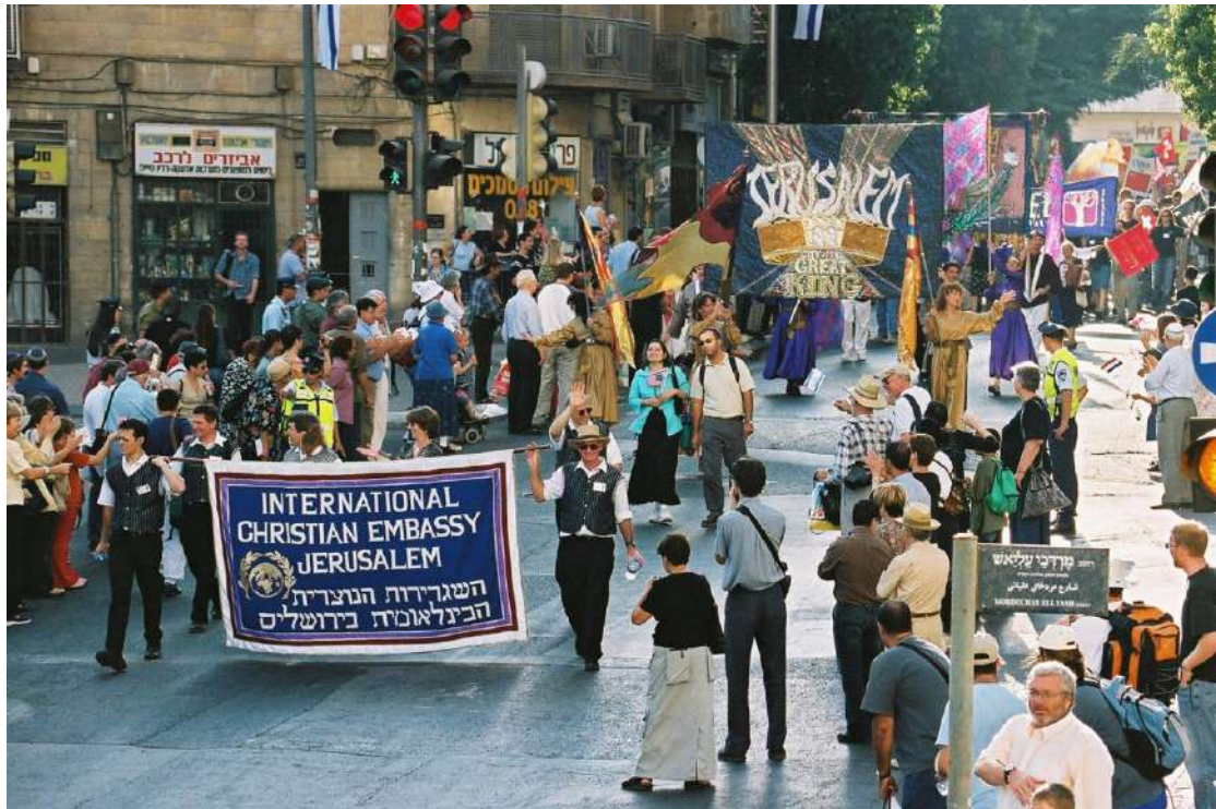
2002 年住棚節慶典-勇敢的朝聖者鼓舞著以色列人

2002 年的住棚節慶典是在巴勒斯坦武裝起義達到高峰時舉行，這些暴動幾乎將所有在以色列的外國觀光客都趕跑了。不過，那年有 2,500 多名基督徒參與住棚節慶典。當一名自殺炸彈客潛入耶路撒冷，鎖定在耶路撒冷遊行中住棚節慶典的朝聖者時，一旁的世界所有主要媒體都預期將發生重大恐攻事件。但我們的國家代表團還是勇敢走完遊行，展現對以色列的支持與勇氣，不只感動以色列人，也贏得全球新聞媒體的尊重。美國有線電視新聞網（CNN）記者向全世界報導這次住棚節慶典時表示：「走在耶路撒冷大街上，支持猶太國家的遊行，展現強而有力的行動。」