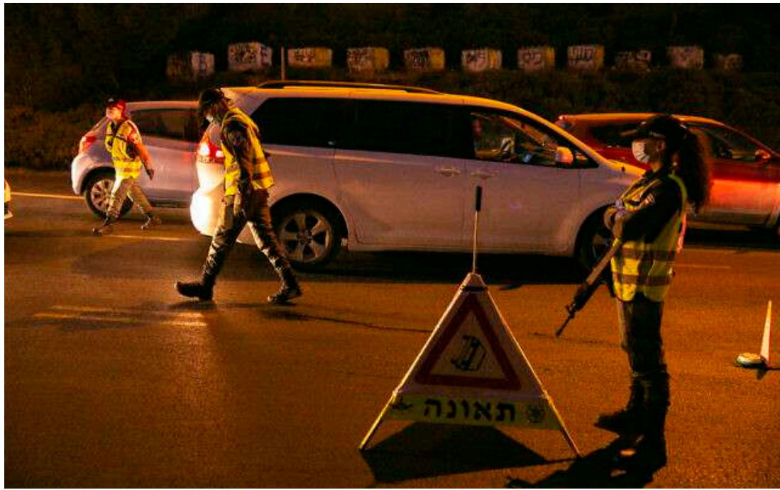
2020 年 9 月 13 日，以色列警方在耶路撒冷鄰近地區拉莫特 (Ramot) 的出口處實施宵禁。拉莫特位於加利利海東海岸的一個定居點。

在新的全國新冠病毒封鎖期間，以色列政府官員放寬了行動限制，官員在週四晚間（9/17）表示，在周五下午（9/18）封城生效後，將從原本宣布離家不得超過 500 公尺，現在允許以色列人在離家 1 公里內自由進出。