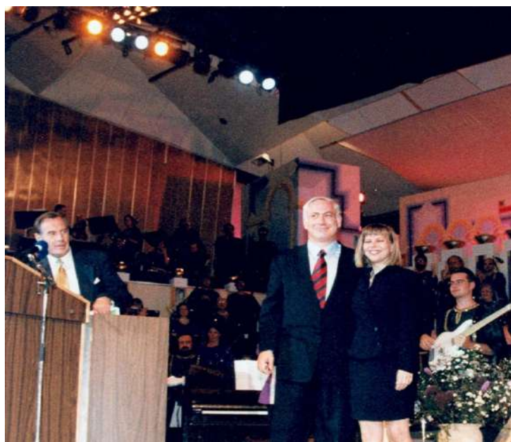
1996 年住棚節慶典-納坦雅胡總理在 ICEJ 慶典上發表重要談話

1987 年底爆發第一次巴勒斯坦大起義（First Palestinian Intifada），到了 1991 年，抗爭嚴重影響以色列的旅遊業。此外，那年正值第一次波斯灣戰爭（First Gulf War），伊拉克獨裁者海珊（Saddam Hussein）向以色列發射數十枚飛毛腿飛彈，讓每個人都必須配戴防毒面具。然而，1991 年的住棚節慶典仍吸引近 8,000 人參加。儘管在恐攻和火箭的威脅下，住棚節慶典仍成為以色列最大的年度旅遊盛會。