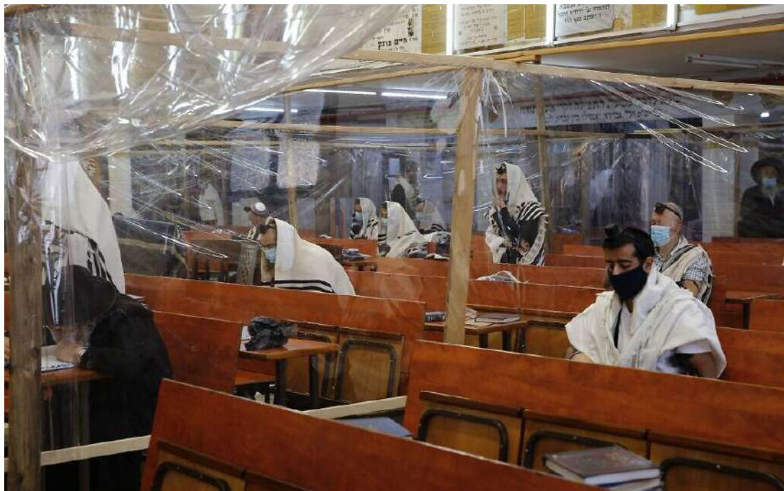
2020 年 9 月 16 日，在利河伯 (Rehovot) 市中心，極端正統派 (Ultra-Orthodox) 猶太人在猶太會堂禱告，會堂中用塑膠布將人隔開，以阻絕冠狀病毒傳播。