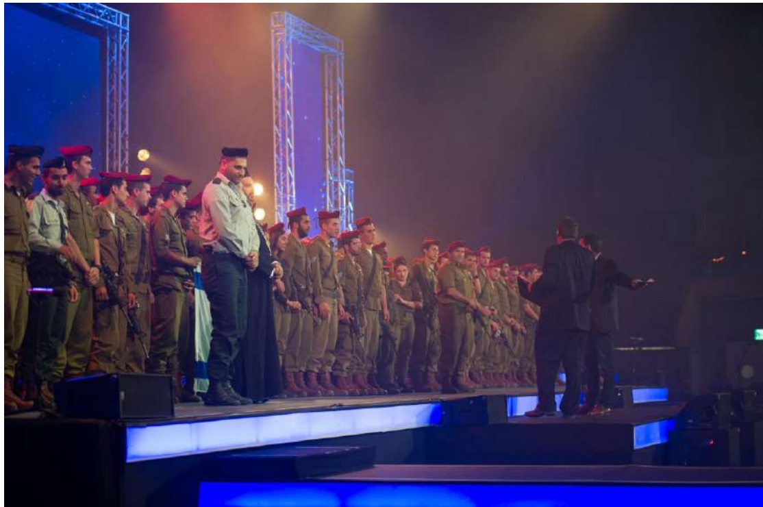
2014 年住棚節慶典-儘管爆發加薩的火箭戰，耶路撒冷巨蛋仍座無虛席

2014 年的住棚節慶典是首次在寬敞的新型耶路撒冷佩斯小巨蛋 (Pais Arena) 舉行的國際盛會。要移師到剛完工的場地是需要信心，因為不確定小巨蛋能否及時完工。此外，會有多少基督徒參與住棚節慶典，仍存在不確定性。因為那年夏天加薩的哈瑪斯 (Ham as) 對以色列展開持久的火箭戰，他們也首次將耶路撒冷列為目標。但大批基督徒又再次從世界各地湧入，以表達他們對以色列的愛與關懷。那年 ICEJ 邀請以色列總統魯文·里夫林 (Reuven Rivlin)、世界猶太人大會 (W orld Jew ish Congress) 主席羅恩·勞德 (Ron Lauder)、來自 17 個國家的 25 名親以色列議員，以及剛參與加薩衝突的 300 名以色列國防軍士兵與會。