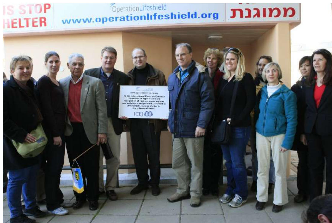
2008 年-加薩邊境城鎮的防彈掩體

2006 年夏天，在第二次黎巴嫩戰爭中( Second Lebanon War )，以色列北部遭受猛烈的炮火攻擊，真主黨 ( Hizbullah ) 共發射了 4,000 多枚火箭。ICEJ 回應這樣的需要，在衝突爆發的五週內，為有需要的家庭提供食物，並為困在悶熱防彈掩體內的孩童提供休閒娛樂。在難忘的出遊行程中，幾輛載著加利利青少年的公車，來到赫茲利亞 ( Herzliya ) 附近的熱門水上樂園，享受一天歡樂時光。