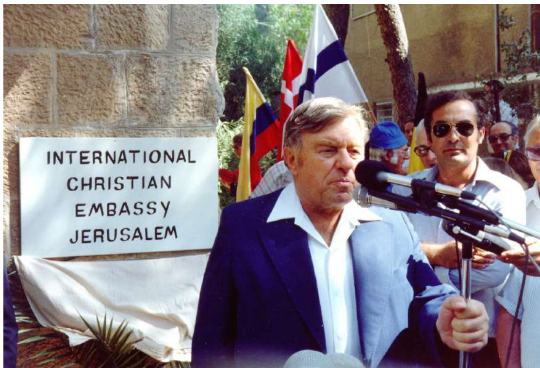
1980 年住棚節慶典-為了聲援以色列成立 ICEJ

當我們回顧過去四十年來，上帝使用 ICEJ 來安慰猶太百姓，其中一種方式就是透過住棚節慶典。每年數千名基督徒朝聖者忠心來到耶路撒冷，對這個猶太國家和人民表達他們的愛與支持。其中幾年，尤其突顯這些朝聖者在艱困時刻為以色列帶來的安慰。當我們回想過去住棚節慶典中一些非常特殊的時刻，希望能夠激勵您，願意加入我們今年線上的 2020 年全球住棚節慶典 (Global Feast 2020)，請直接點擊耶路撒冷基督徒使館線上住棚節特會 連結報名 。