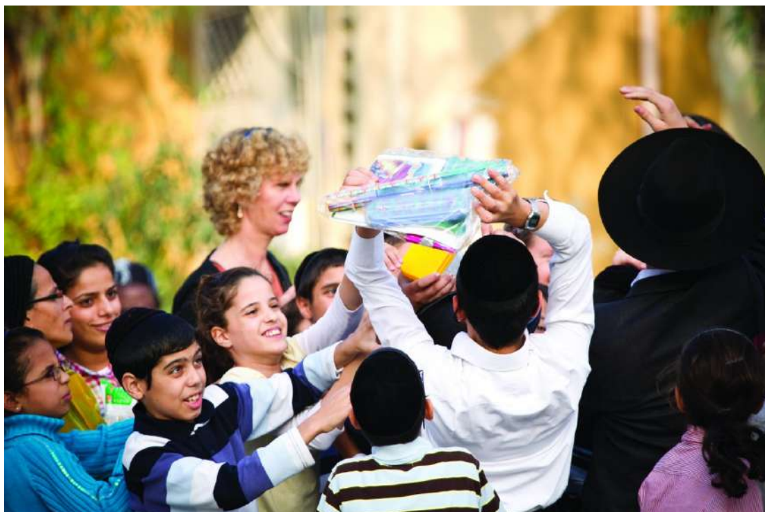
2012 年-在另一場加薩戰爭中捍衛以色列

2012 年 11 月，以色列在加薩面臨與哈瑪斯的另一場火箭戰，但這次以色列整個南部大半地區都遭受大火侵擊，其中包括耶路撒冷。