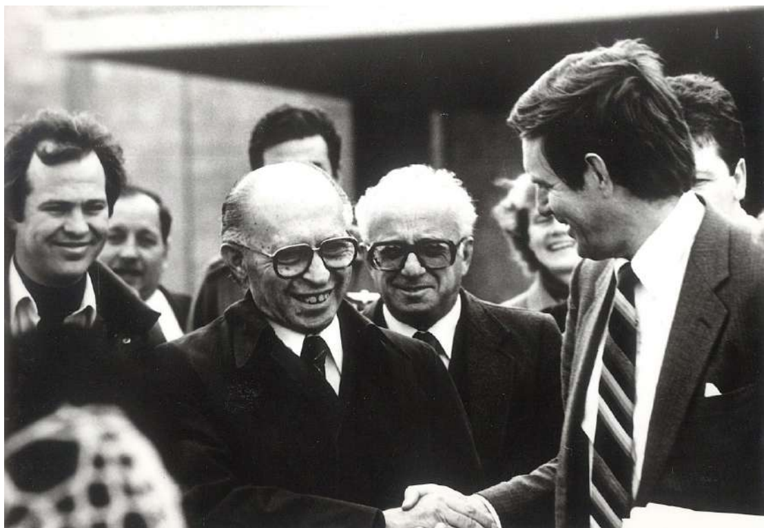
1980-1983 年-梅納罕·比金 ( Menachem Begin ) 和 ICEJ

在 1982 年夏季的「加利利和平方動 ( Operation Peace for Galilee )」期間，初期考驗著 ICEJ 與以色列一同站立的決心。當時的以色列總理梅納罕·比金 ( Menachem Begin ) 派遣以色列部隊進入黎巴嫩南部，以保護加利利地區免受巴勒斯坦解放組織 ( PLO ) 的火箭和恐怖攻擊。當這場軍事戰役在以色列本地失去公眾支持後，比金隨即下令撤退。不過，在最初的黎巴嫩行動中，ICEJ 為外國記者安排一次特別的巴士之旅，參觀以色列北部的邊境地區，更近身瞭解這場衝突以及其根本原因。這次實地考察團有助於釐清當前局勢的某些現況，讓部分媒體對於以色列國防軍為何深入黎巴嫩持正面的報導。ICEJ 領袖同時讓以色列官員與黎巴嫩基督徒社區領袖保持秘密聯繫。之後，當比金辭職下台，ICEJ 發信向他致謝，感謝他的友誼，以及他在 1980 年支持 ICEJ 的成立。