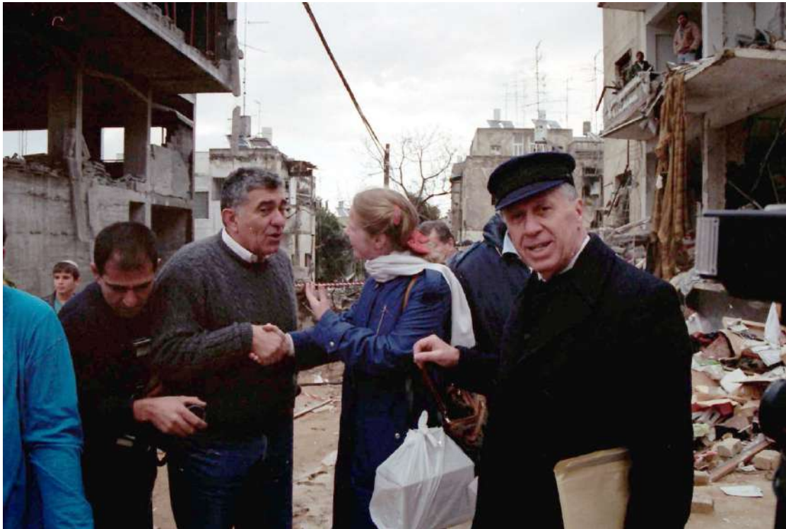
1991 年-回應伊拉克的飛毛腿飛彈

比金回信寫道：「在我們因信仰被國際社會拋棄時，你們決定在耶路撒冷成立機構是一項義勇之舉，更象徵我們關係緊密。你們展現的行動與善意，讓我們感覺自己並不孤單。」