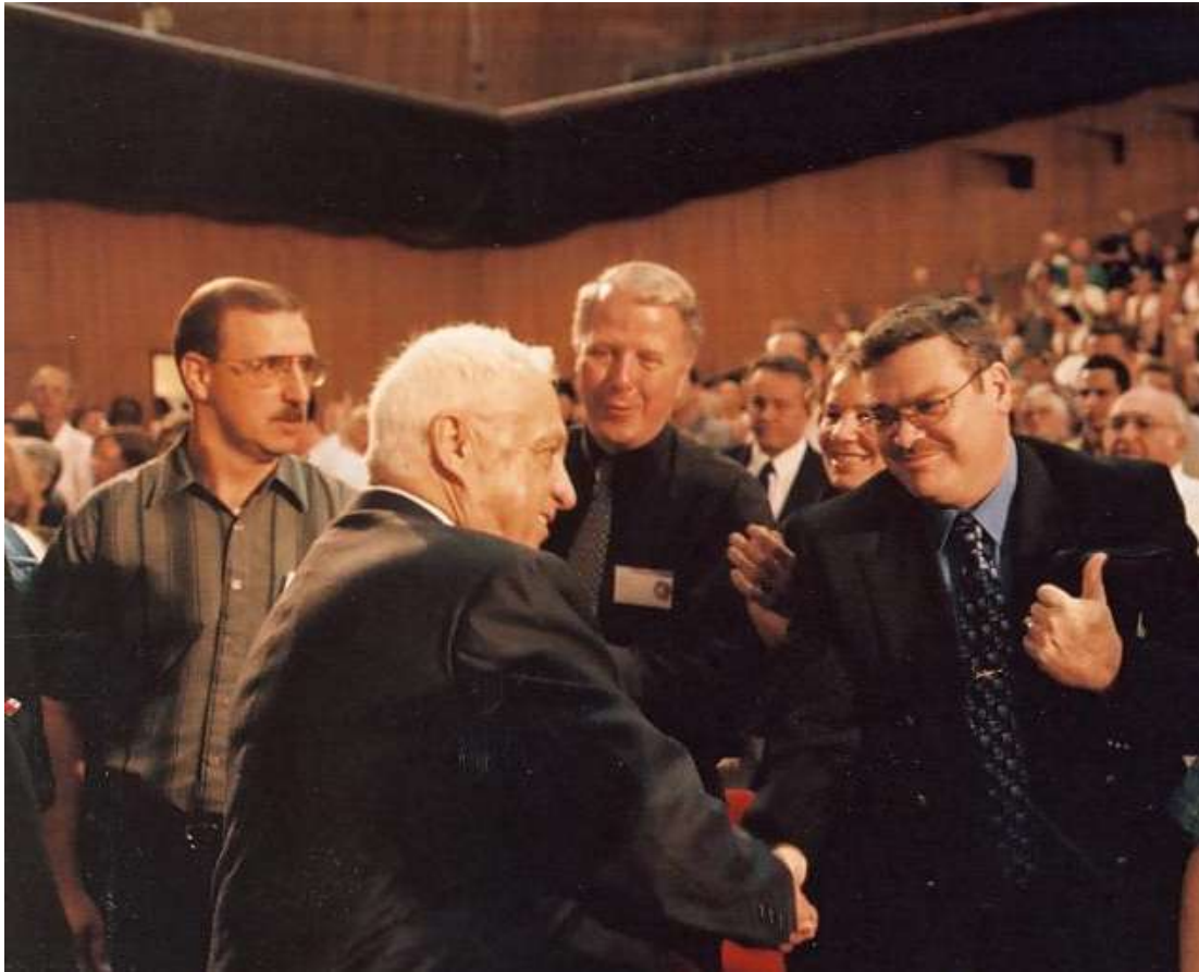
2000 年住棚節慶典—儘管發生巴勒斯坦人起義，但聚會仍爆滿

2000 年 9 月下旬，奧斯陸和平談判破裂後，巴勒斯坦領袖對以色列發動武裝起義。儘管在以色列土地上發生暴力衝突，但就在幾週後，數千名勇敢的基督徒仍出現在住棚節慶典，表達對以色列的支持。ICEJ 向耶路撒冷市長歐默特（Ehud Olmert）遞交由 100 多個國家 12 萬多名基督徒簽署的請願書，表達支持以色列對統一後的耶路撒冷宣示主權。以色列反對派領袖夏隆（Ariel Sharon）因「第二次巴勒斯坦大起義（Second Intifada）」的爆發成了眾矢之的。在結束兩週來對媒體在該問題上保持的緘默後，夏隆在住棚節慶典聚會中致詞表示：「你們是我們在世界各地的最佳朋友」，並感謝基督徒對以色列的支持。