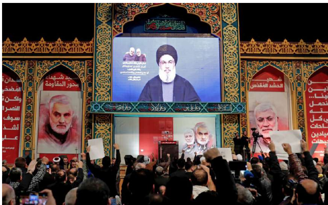
2020 年 1 月 5 日，在黎巴嫩首都貝魯特南方郊區，什葉派真主黨恐怖組織的支持者觀看銀幕上播出其領袖納斯魯拉發表的談話。

真主黨之前的事件都與硝酸銨有關，包括在德國和英國分別發生兩起事件，在當時都受到廣泛的報導。據報導指出，真主黨人員被發現攜帶大量硝酸銨。