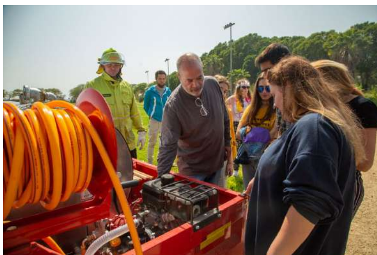
2018 年—贊助加薩邊境城鎮的消防設備

2014 年夏天，以色列和哈瑪斯在加薩邊界一帶爆發第三次大規模的火箭戰。在為期 50 天的衝突中，ICEJ 為脆弱社區另外提供十座可攜式防彈掩體，帶著一群孩童和老人暫時前往以色列較安全的地區，並資助 40 名來自亞實基倫（Ashkelon）重災區的年輕人出國旅行。同時，ICEJ 的許多分支機構再次集會，捍衛以色列不受伊斯蘭恐怖攻擊的威脅。