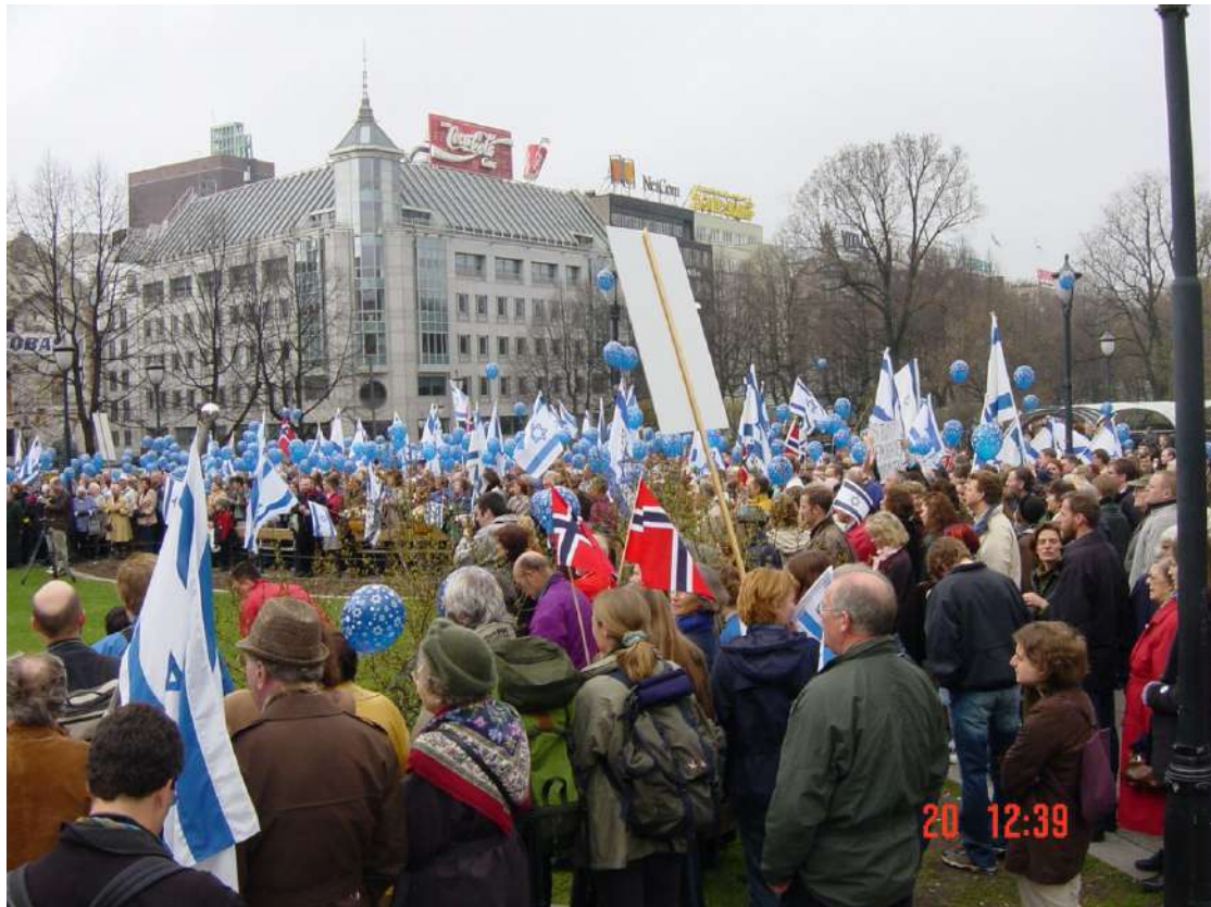
2010 年—針對加薩船隊事件在分支機構舉辦集會

2010 年 5 月，以色列因攔截加薩船隊而飽受譴責，ICE J 全球分支機構舉辦集會，支持以色列的自衛行動。