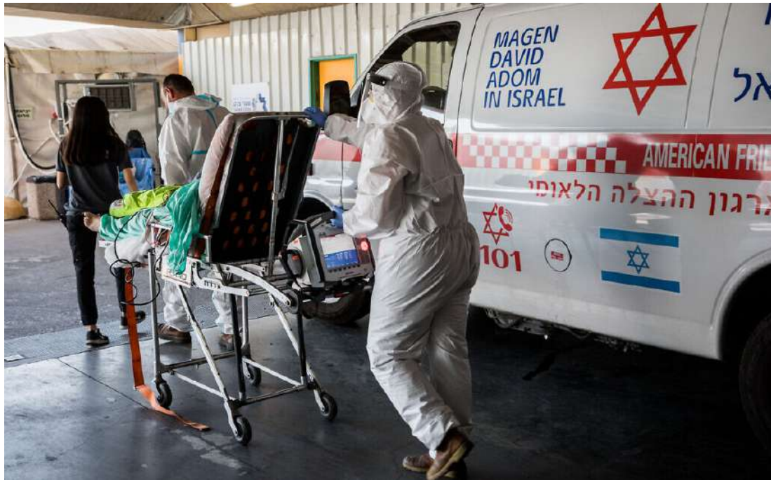
2020 年 9 月 14 日，在耶路撒冷的沙勒澤德克醫院 ((Shaare Zedek Hospital)，紅大衛盾會 (Magen David Adom) 醫護人員身穿防護衣就在冠狀病毒醫護站外。

以色列在最近幾週出現新冠病毒病例激增的情況，該國成了世界上平均病毒感染率最高的國家之一。根據以色列衛生部於週四（9/17）發布的數據顯示，週二（9/15）的新增單日病例來到約 5,500 例歷史新高，但到週三（9/16）單日新增病例又降至 4,546 例。