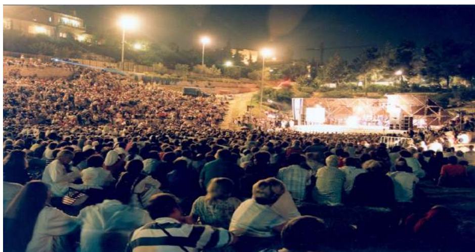
1991 年住棚節慶典—儘管發生巴勒斯坦大起義，但參加人數仍創新高

在 1982 年第三次住棚節慶典前夕，活動移師到大型的耶路撒冷國際會議中心（ International Convention Center ）舉行。但那年夏天正值第一次黎巴嫩戰爭（ First Lebanon War ）爆發，ICEJ 領袖不預期會有大批人潮出現。但那年有將近 100 個國家約 5,000 名基督徒朝聖者參與這場盛會，許多人都是最後一刻才加入。這為以色列大眾帶來極大的鼓舞，尤其是耶路撒冷遊行（ Jerusalem March ）。從 1970 年代初期，以色列人會在住棚節（ Sukkot ）期間，在耶路撒冷大街上舉辦傳統遊行，但到這個時候，以色列人已失去舉辦遊行的動力。事實上，以色列國防軍表示，他們沒有往常一樣充足的預算，能夠調度軍隊到市區參加遊行；耶路撒冷警方希望假期與家人一起過節，而不是加班值勤來維護遊行安全。因此，市府官員已準備取消這場耶路撒冷遊行。不過，當我們的基督徒代表團開始加入遊行行列，這場遊行又再度成為焦點。1982 年，當以色列全國對於黎巴嫩境內的戰事，以及國際社會的嚴厲批評感到憂心時，數千名友好的基督徒在耶路撒冷街道上遊行，是多麼令人振奮的景象。自此之後，耶路撒冷遊行就成了基督徒朝聖者與以色列人的住棚節熱門活動。