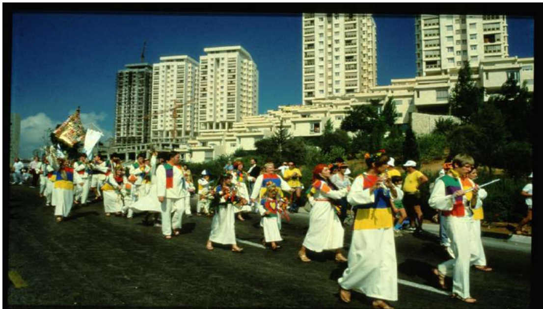
1982 年住棚節慶典—儘管發生黎巴嫩戰爭，參加慶典人數仍增加到 5,000 人

實際上，ICEJ 是在 1980 年 9 月於耶路撒冷舉辦的第一場住棚節慶典中誕生。當慶典籌辦委員會在那年夏天預備這場盛會時，以色列政府宣布，將統一後的耶路撒冷視為猶太國的永久首都，因此引發一場外交風暴。當基督徒在耶路撒冷準備出席這場盛會時，阿拉伯國家以石油禁運當作威脅，最後 13 個國家使館撤出耶路撒冷，準備遷往特拉維夫。慶典主辦單位回應這樣的時刻，很快就決定成立永久機構，表達基督徒支持以色列以及其對耶路撒冷的主張。在為期一週的聖經慶典活動第三天，新成立的 ICEJ (International Christian Embassy Jerusalem) 選定一棟建築作為該機構所在地。受人景仰的耶路撒冷市長特迪·科勒克 (Teddy Kollek) 主持這次機構的啟用典禮，來自 32 個國家的 1,000 名基督徒出席這次儀式，科勒克形容這是他一生中最感動的經歷之一。以色列首席拉比什洛莫·戈倫 (Shlomo Goren) 以詩篇 118:26 的傳統住棚節問候來為基督徒朝聖者祝福：「奉耶和華名來的是應當稱頌的！」