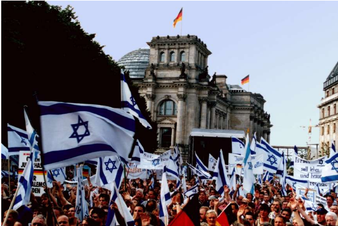
2009 年-在加薩火箭戰期間為以色列人提供救助

一旦警報聲響起，只有 15 秒時間能找到安全地點。對於遭到強敵環伺的以色列人來說，防彈掩體是一項能拯救性命的措施。自此後的十二年內，ICE J 已在加薩邊界一帶的以色列城鎮和村莊，捐贈了 110 座強固型防彈掩體（防空洞）。