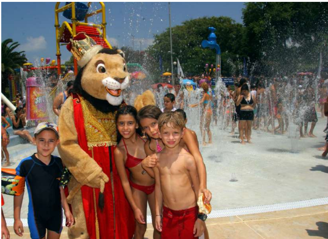
2006 年—第二次黎巴嫩戰爭期間的救助行動

在第二次巴勒斯坦起義（Second Palestinian Intifada）的艱難時刻，ICEJ 採取其他各種行動來為以色列人帶來安慰。例如為埃弗拉特（Efrat）的學童捐贈一輛防彈校車，並為以色列各地的安全部隊提供炸彈探測犬「又名嗅彈犬」。數十個 ICEJ 分支機構還在世界各地舉行公眾集會，在一波以反猶太復國主義（Anti-Zionism）為名日益猖獗的反猶太主義浪潮中，捍衛猶太國家和人民。同時，在歐洲一些 ICEJ 分支機構於布魯塞爾的歐洲議會（European Parliament）舉辦研討會，成功質問歐盟委員會（European Commission）關於為巴解組織提供現金外援的政策。