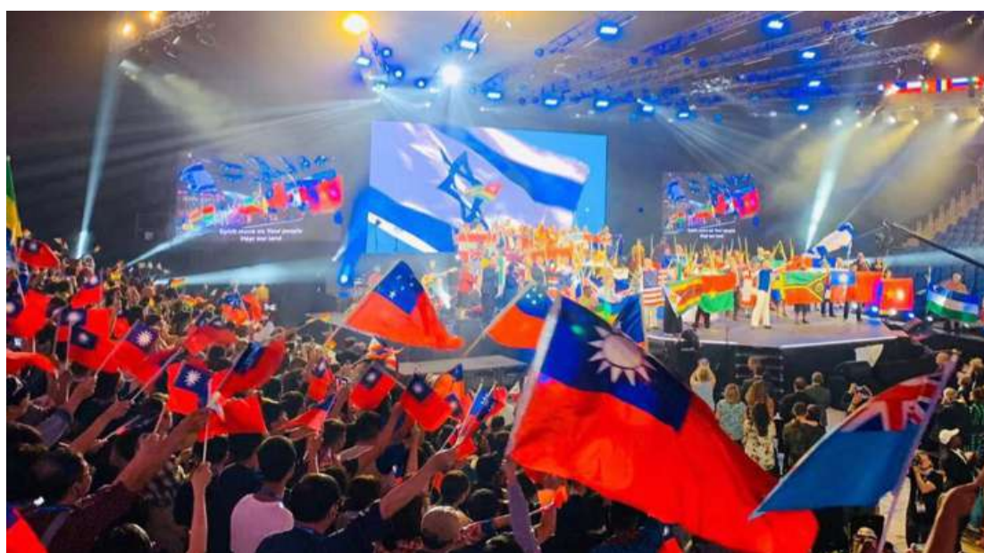
2019 年台灣 ICEJ 住棚節走禱團於耶路撒冷佩斯小巨蛋與列國基督徒歡慶住棚節。