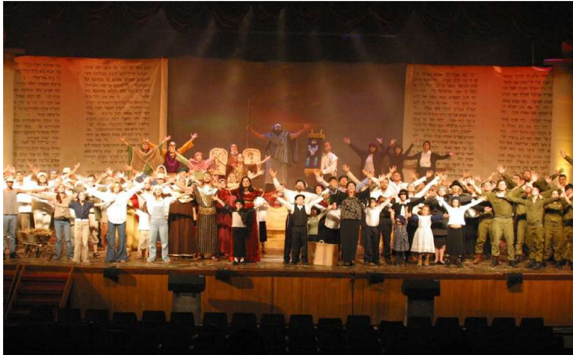
2001 年-《聖約》提振以色列人精神

代表大會以禱告以及聲援遊行作為結束，遊行一路從大猶太會堂（Great Synagogue）到大衛塔（Tower of David），最後來到哭牆廣場。