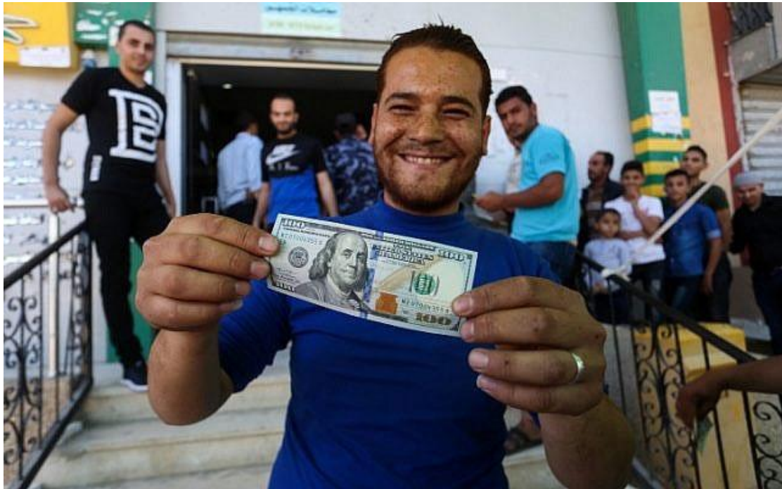
2019 年 7 月 21 日，一名巴勒斯坦百姓開心地拿著領取卡達提供的現金援助。

介入巴勒斯坦局勢是卡達鞏固區域地位的重要工具。卡達將此地位視為該國在中東地區存在的保障，因為過程中，卡達會被該地區其他國家視為不可或缺的要角。更重要的是，這能夠維繫卡達與美國之間的重要關係。