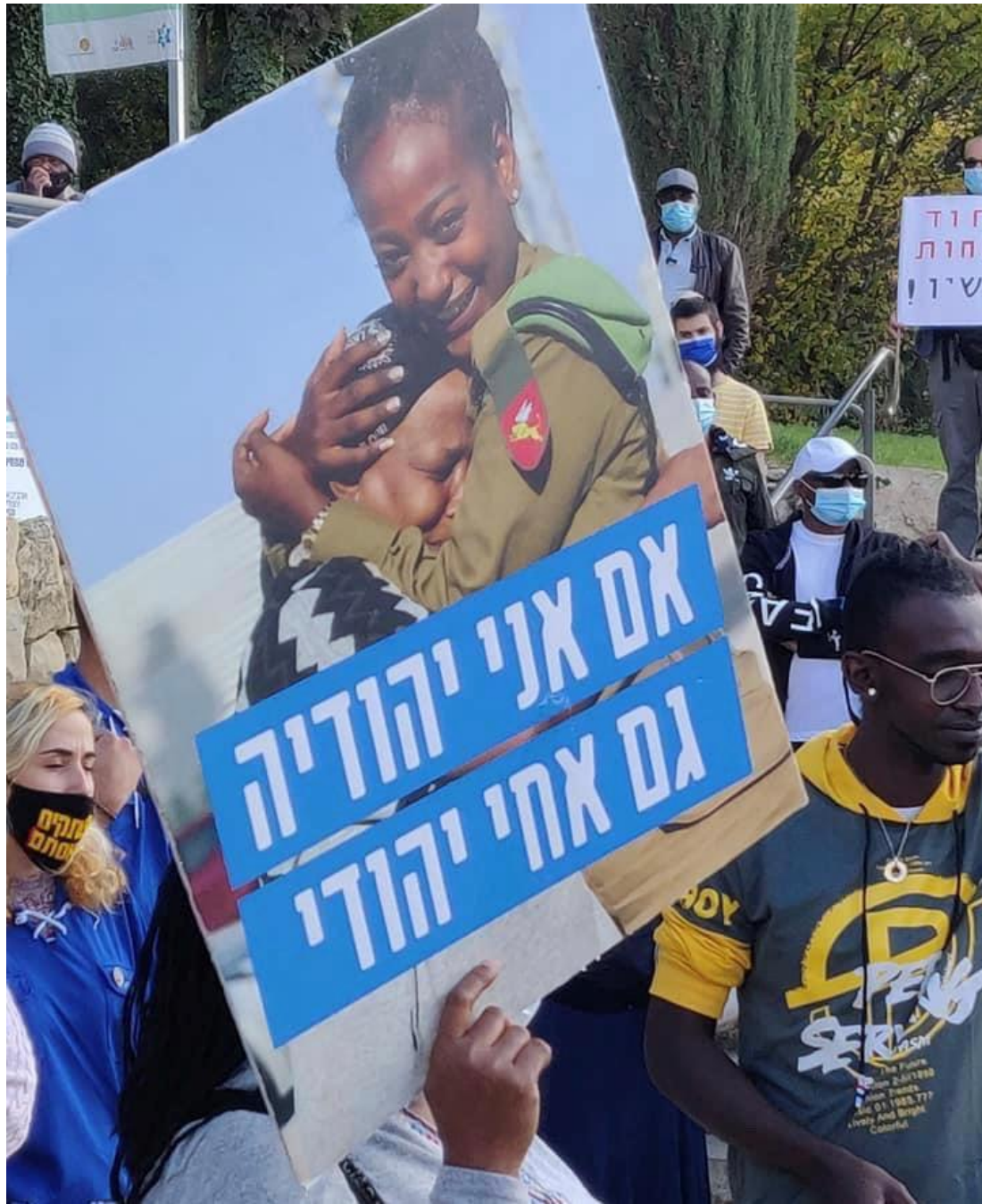
2020 年 11 月 25 日，衣索比亞猶太社區成員在耶路撒冷總理辦公室外舉行示威活動，他們高舉親人照片，要求以色列政府，將他們仍留在衣索比亞的數千名親人帶回以色列。

自從提格雷省爆發武裝衝突以來，已有超過 4 萬名衣索比亞人為了躲避戰火，逃到蘇丹東部。