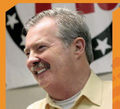
/ US CONGRESSMAN MIKE SODREL