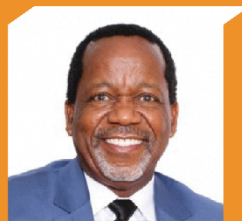
MP. KENNETH MESHOE