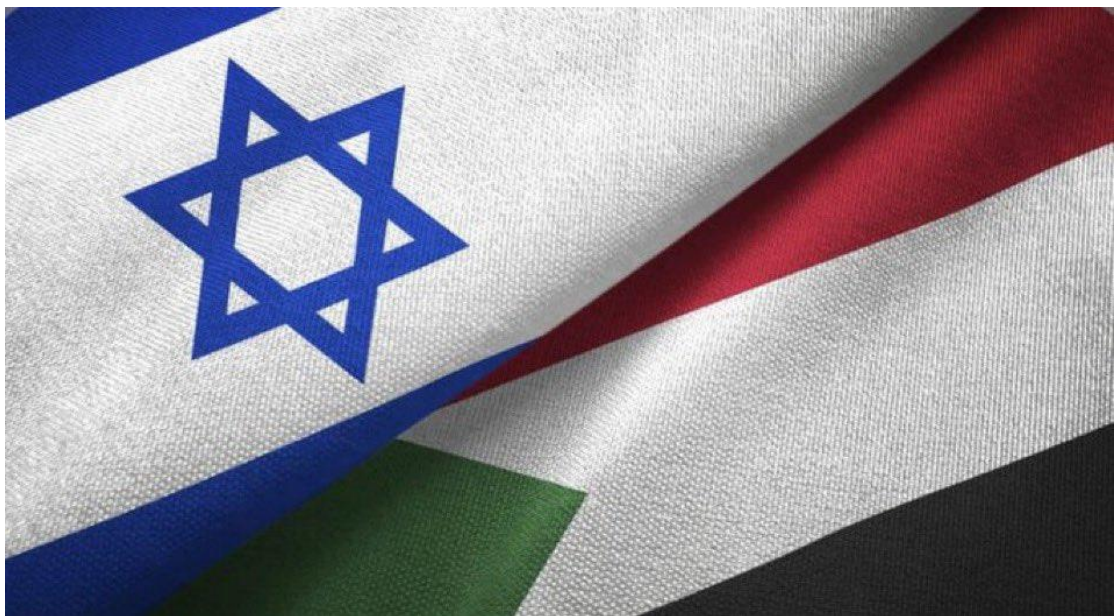
為以色列和蘇丹成就外交正常化協議合作禱告