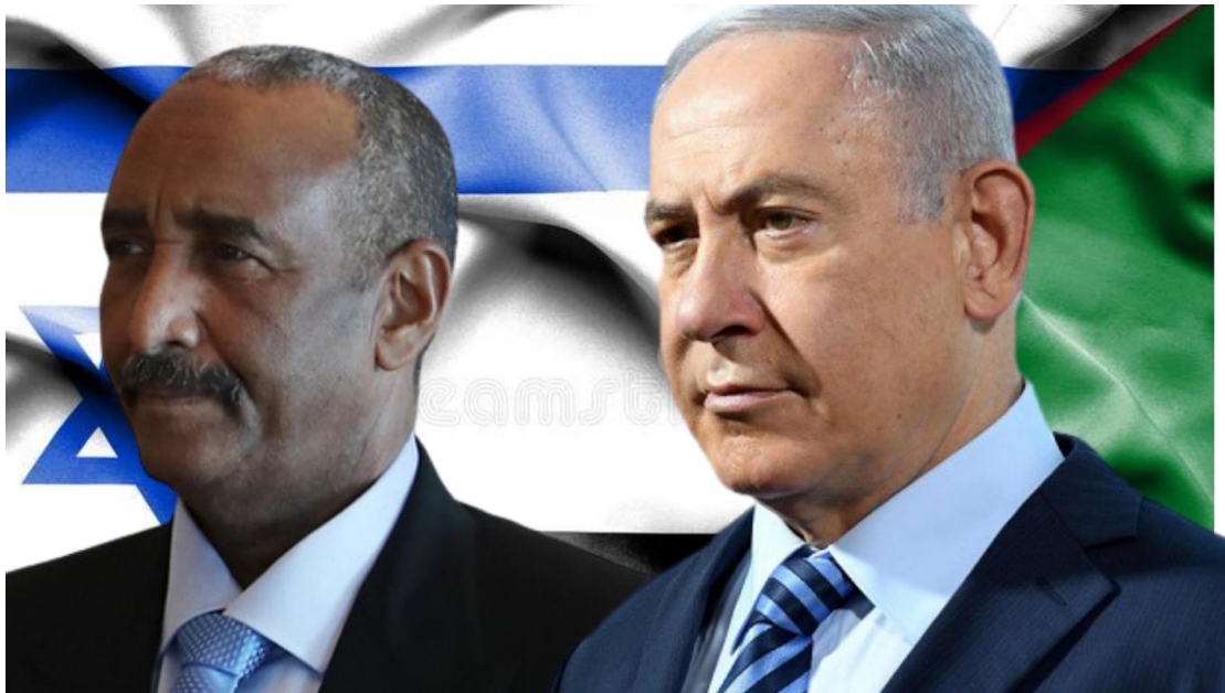
(左)蘇丹總統阿卜杜勒·法塔赫·阿卜杜勒拉赫曼·布爾漢(Abdel Fattah Abdelrahman Burhan)與(右)以色列總理班傑明·納坦雅胡(Benjamin Netanyahu)。

據報導，以色列官員擔心，如果美國華府不將蘇丹從恐怖主義資助國名單除名，以色列與蘇丹之間關係正常化的協議將無法實現。