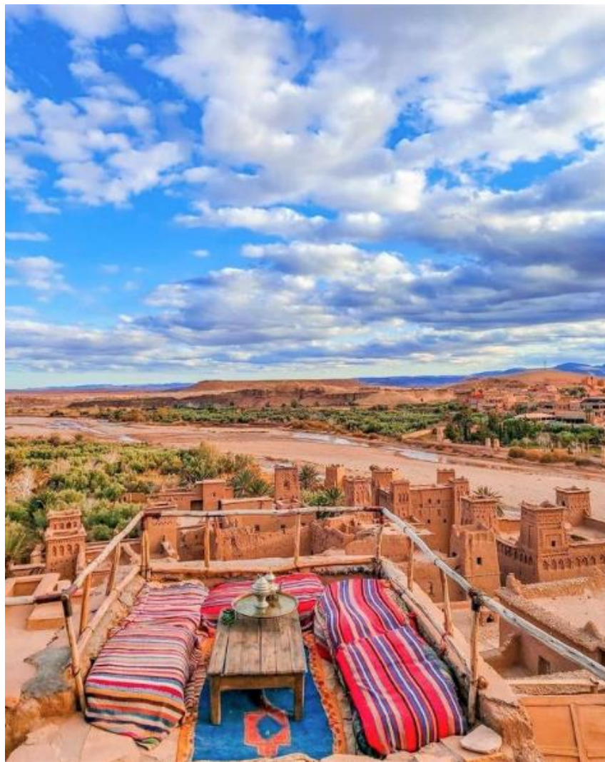
摩洛哥南部古城埃本哈杜(Aït Ben Haddou)