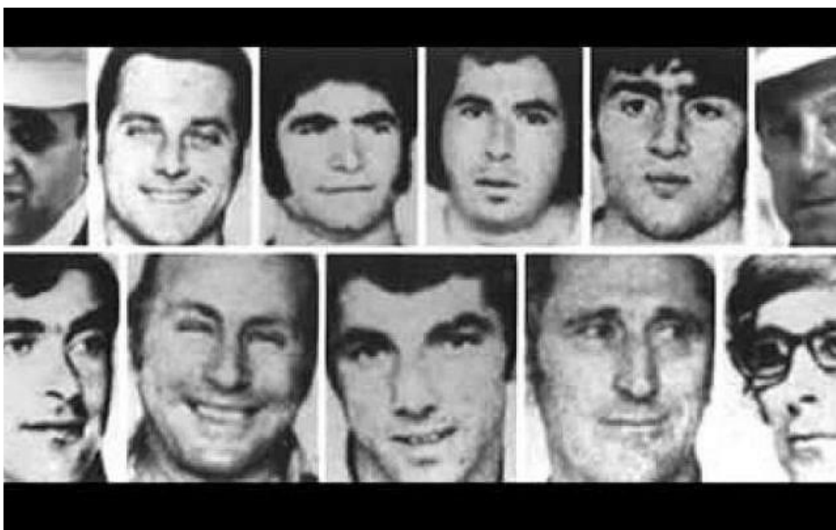
11 名以色列慕尼黑奧運會遇難者。

在奧運會開幕式上，首次為被巴勒斯坦恐怖分子殺害的 11 名以色列運動員默哀；受害者的遺孀說：「這是我們長久等待的時刻」