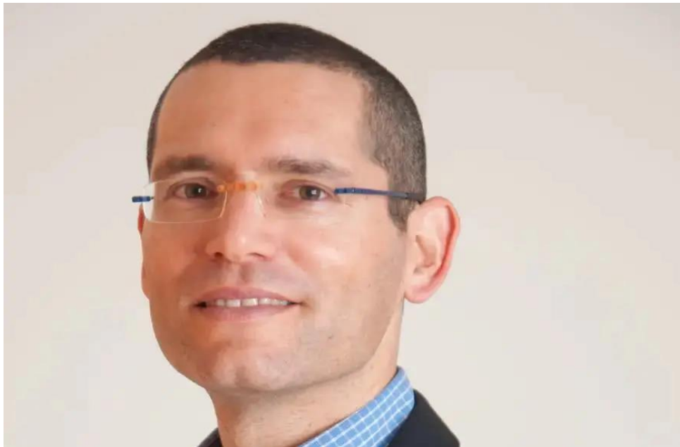
奧拉梅德製藥公司(Oramed Pharmaceuticals)執行長納達夫·基德倫(Nadav Kidron)照片

奧拉瓦克斯(Oravax)在歐洲製造的數千顆膠囊已經通過了優良製造標準(GMP, Good Manufacturing Practice)，這些膠囊將用於以色列臨床試驗，之後也會推行在其他國家。