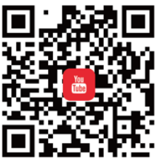
台灣ICEJ YouTube 觀看最新影音新聞、 歸回與慈惠事工影片