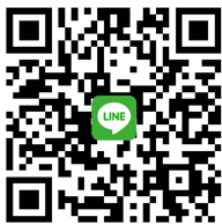
台灣ICEJ Line@ 每週以色列新聞及代禱消息