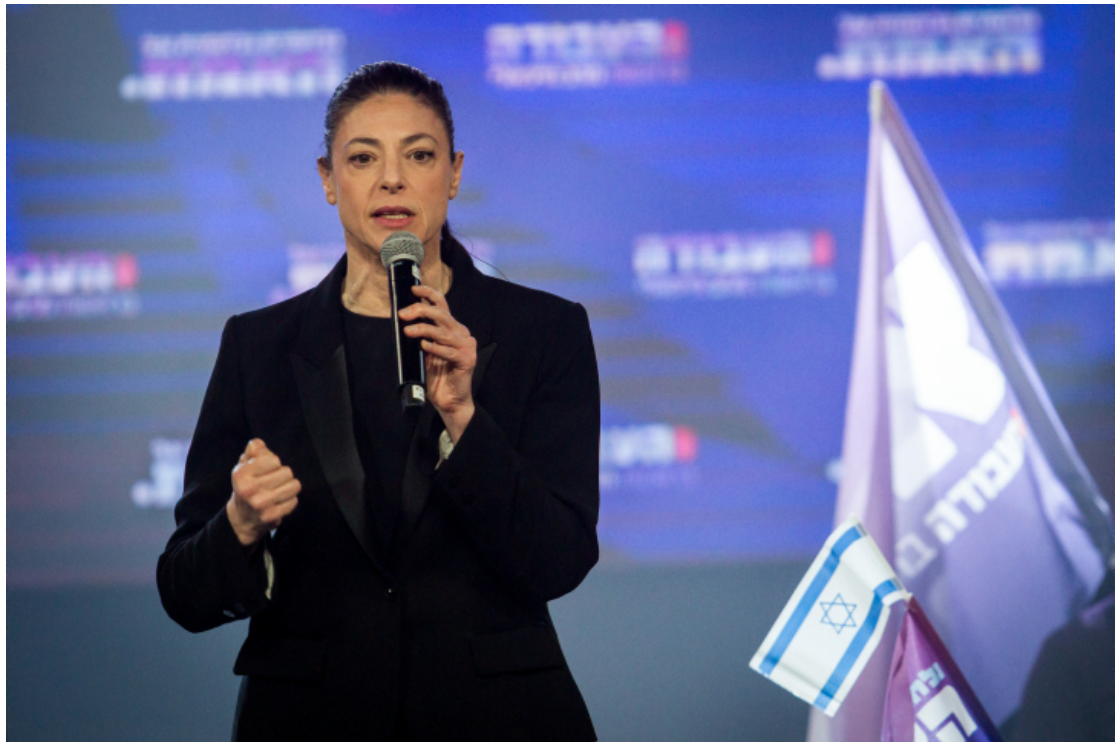
梅拉夫·米夏埃莉。