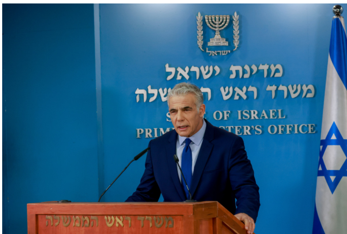
亞伊爾·拉皮德(註:以色列現任總理)。