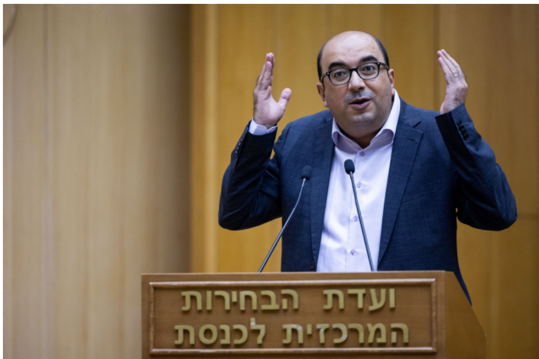
薩米·阿布·謝哈德。

作為司法部長 ( 2015-2019 年 ) 沙凱德試圖掌握以色列最高法院的權利，這在右翼人士看來是過分的舉動。她支持對恐怖份子判處死刑與更傾向資本主義的經濟。在最近的一次採訪中，她堅稱她將通過選舉門檻，並再次要求重回司法部的工作。