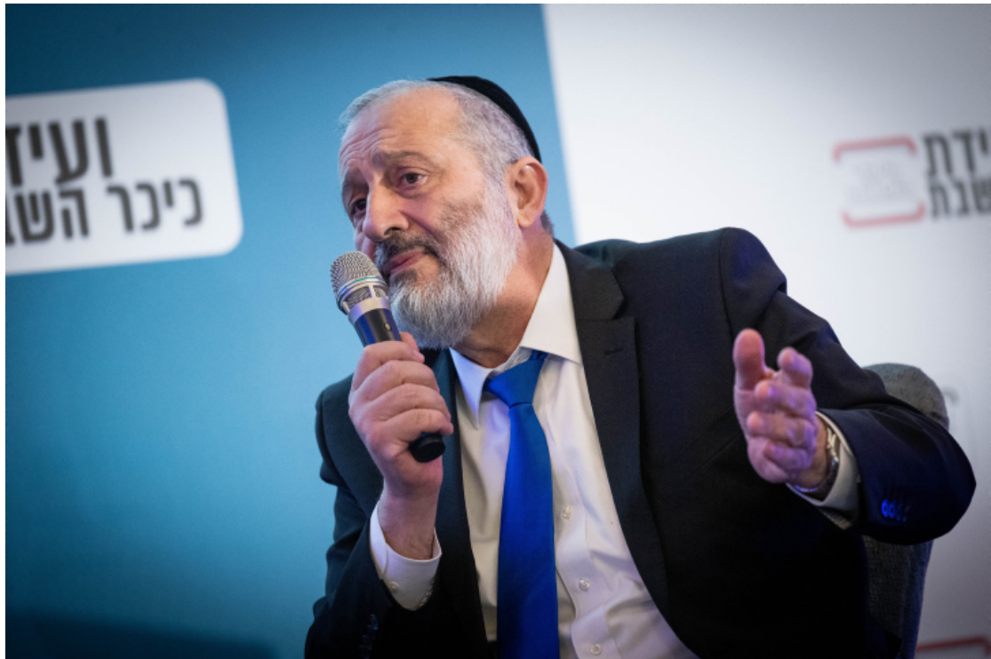
阿里耶·德里。