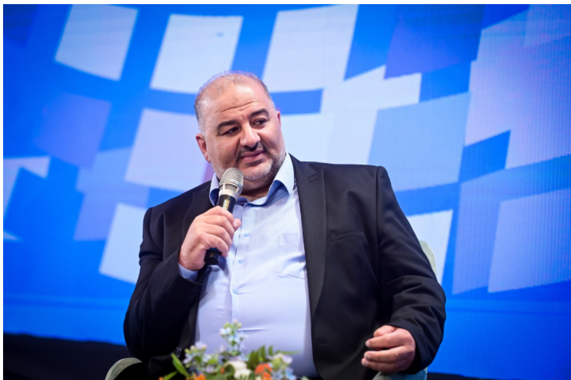
曼蘇爾·阿巴斯。

梅雷茲黨支持建立一個以耶路撒冷部分地區為首都的巴勒斯坦國。加倫在 1999 年呼籲結束回歸法（Law of Return），該法賦予散居國外的猶太人自動獲得以色列公民身份的權利，加倫稱該法律具有「歧視性」。