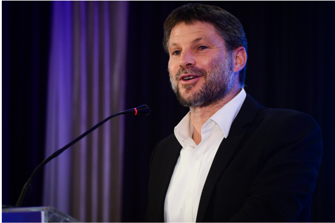
貝扎萊勒·斯莫特里赫。