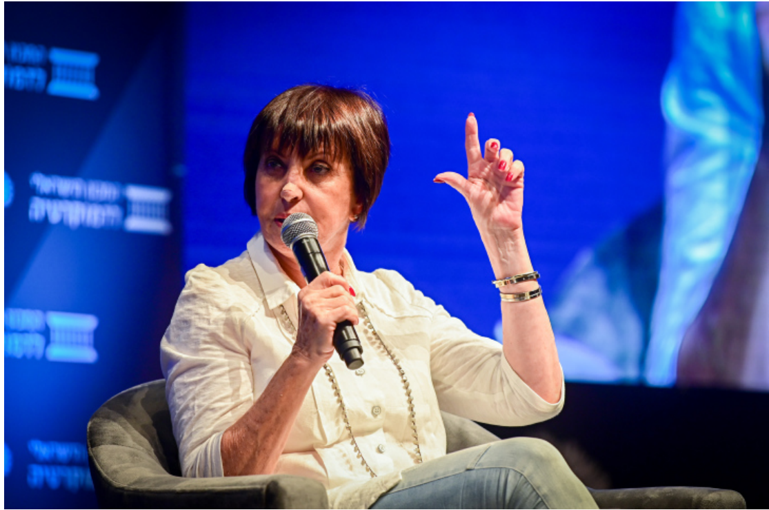
澤哈娃·加倫。