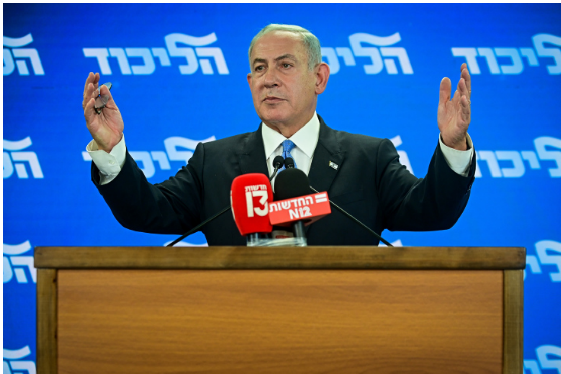
班傑明·納坦雅胡。

以色列任職時間最長的總理、現任在野黨領袖班傑明·納坦雅胡將繼續努力贏得他的第六個總理任期，甚至連他的敵人也承認他的政治天賦和對經濟學的強大掌握能力。他因著將以色列受到嚴格監管的經濟轉變為資本主義的高科技強國而備受讚譽。最近的民意調查顯示，這一次他將有足夠的國會席次來組建政府。