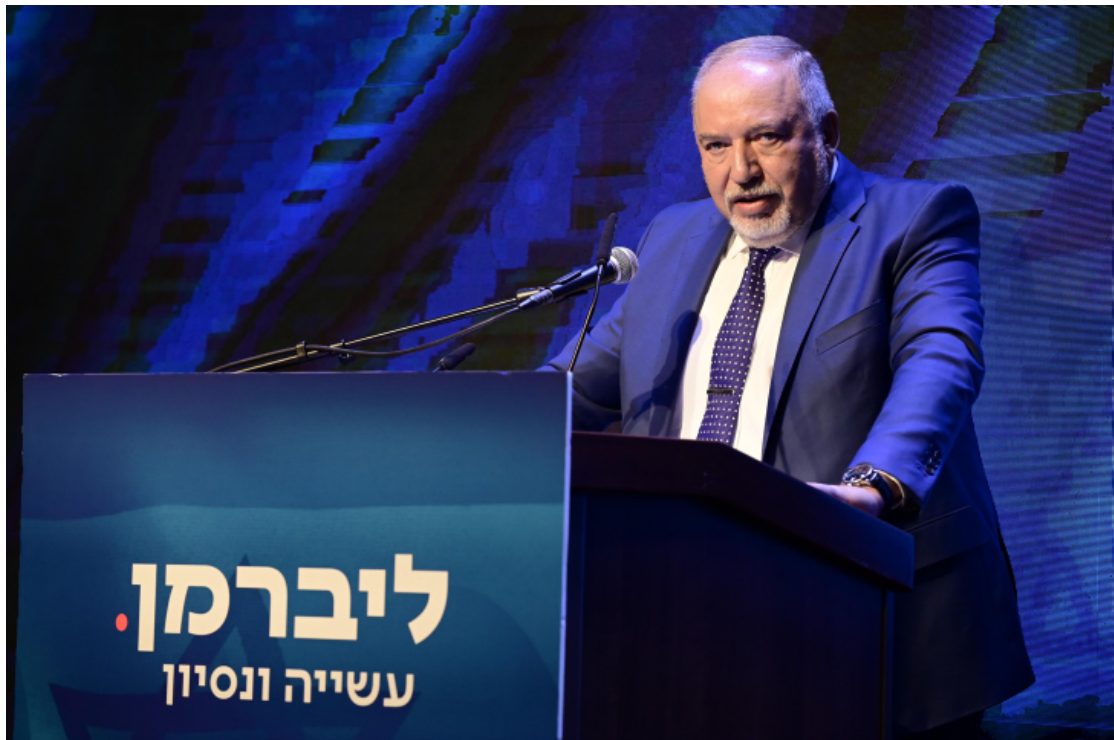
阿維格多·李柏曼。

聯合妥拉猶太教黨和沙斯黨組成了一個約有 15 個席次的聯盟，為班傑明·納坦雅胡提供了可靠的支持，以換取對其機構的資助。這種合作關係使納坦雅胡受到批評，因為極端正統猶太教派是一個不受許多以色列人歡迎的群體，他們被認為沒有為國家福祉做出貢獻。