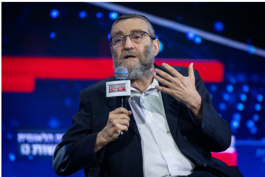
摩西·加夫尼。