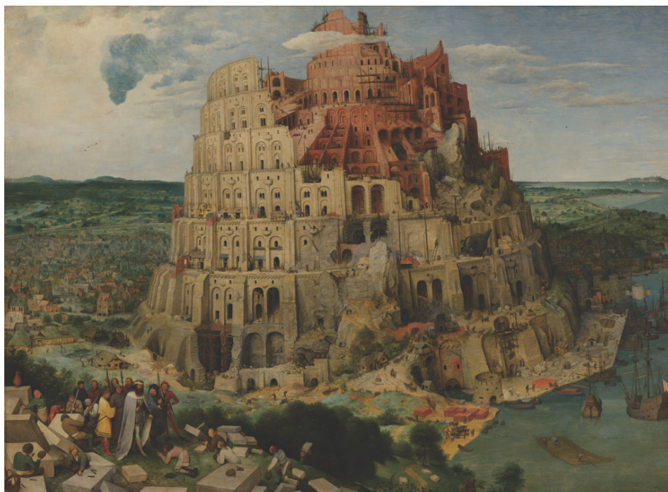
老彼得·布勒哲爾 ( Pieter Bruegel the Elder ) 繪製的巴別塔。