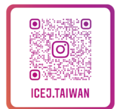
台灣ICEJ Instagram 以色列生活大小事、 節日卡片、經文圖與您分享