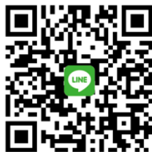
台灣ICEJ Line@ 每週以色列新聞及代禱消息