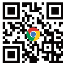
台灣ICEJ官方網站 完整資訊都在這 (可到網站下方 訂閱免費電子報)