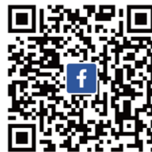
台灣ICEJ Facebook 不錯過即時消息與影片