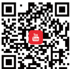
台灣ICEJ YouTube 觀看最新影音新聞、 歸回與慈惠事工影片