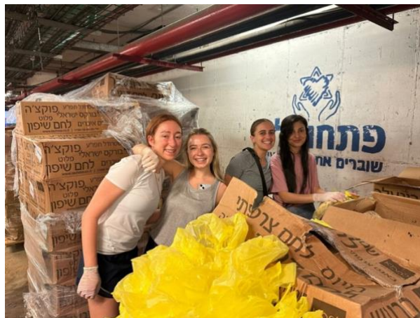
大學生志願來服務和分裝食品。