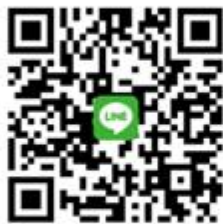
台灣ICEJ Line@ 每週以色列新聞及代禱消息