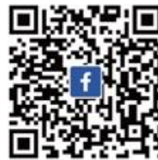
台灣ICEJ Facebook 不錯過即時消息與影片