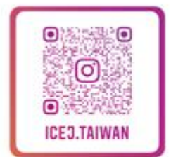
台灣ICEJ Instagram 以色列生活大小事、 節日卡片、經文圖與您分享