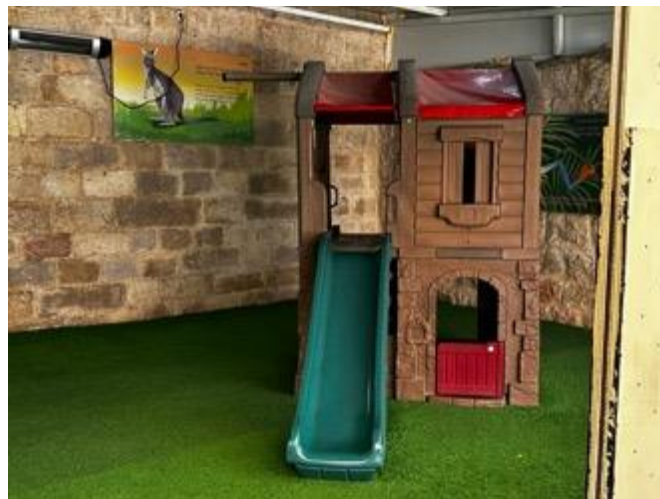
小心肝幼兒園的遊樂場。

「小心肝幼兒園」的老師們都有一種使命感，那就是投資在每個孩子的未來，讓他們一生走在積極向上的道路上。