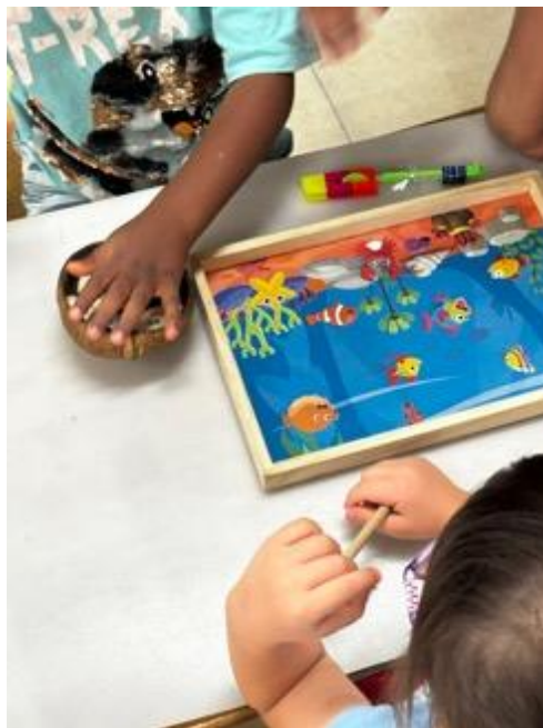
孩子們在做藝術品。