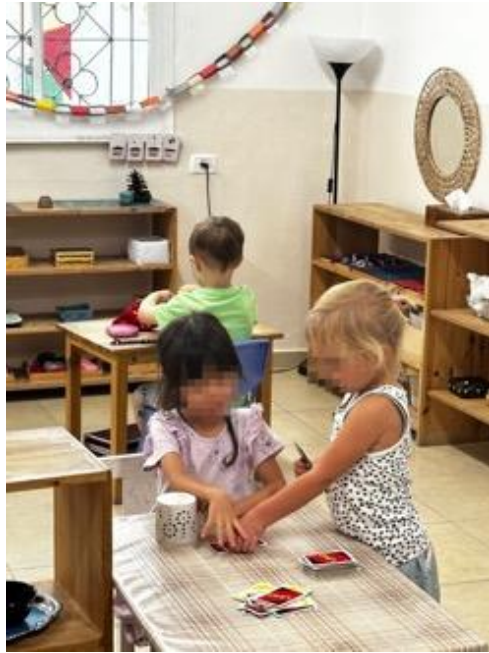
在小心肝幼兒園的有趣學習活動。