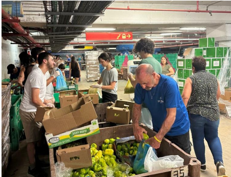
志工們正在分裝食物