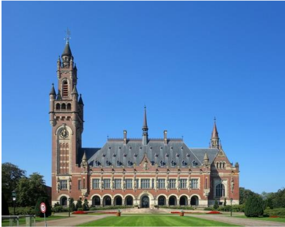
海牙和平宮。

此時，聯合國大會少數成員於兩年前所要求的諮詢意見（聯合國大會第 77/247 號決議）將不再具有約束力，且這整件事自一開始已明顯帶有偏見，對以色列而言十分不利。但巴勒斯坦人仍將會利用此裁決，進一步推動他們妖魔化以色列、使以色列去合法化並最終摧毀以色列的計畫。