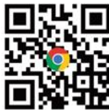
台灣ICEJ官方網站 完整資訊都在這 (可到網站下方 訂閱免費電子報)