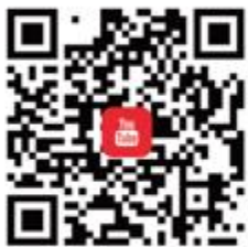
台灣ICEJ YouTube 觀看最新影音新聞、 歸回與慈惠事工影片