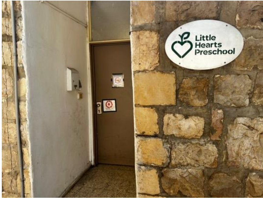
小心肝幼兒園的入口。

這裡毗鄰阿拉伯人和極端正統猶太人的居住區，人們可能認為這裡會是一個局勢緊張的地方。然而，當我們走過耶路撒冷市中心的街道時，「小心肝」幼兒園 ( Little Hearts Preschool ) 映入眼簾，各種背景的孩子們在父母的陪伴下興高采烈地衝進園內。在這樣一個敏感的地區，這所學校完美體現了其使命：創造一個安全的環境，讓來自不同宗教和種族的孩子可以一起學習，相互支持。